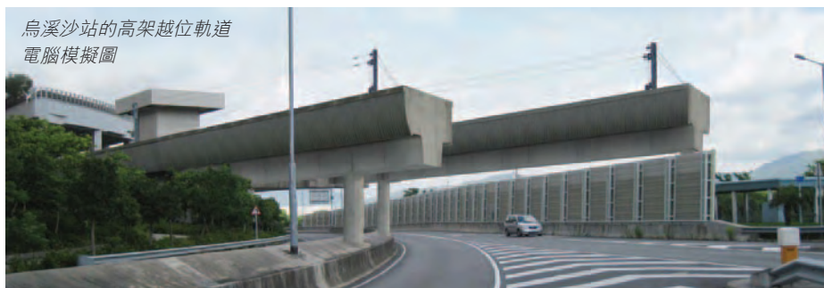
烏溪沙站的高架越位軌道 電腦模擬圖

為配合8卡列車的運作，烏溪沙站的高架越位軌道將會延長，並在西沙路興建高架軌道的支柱。建造期間，西沙路須實施臨時交通管制措施。