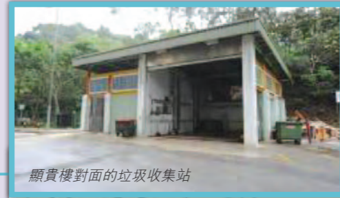
顯貴樓對面的垃圾收集站

為配合顯徑邨附近的隧道入口建造工程，我們建議將顯徑邨顯貴樓對面的垃圾收集站臨時重置於顯富樓對面的空置土地。工程完成後，原有的垃圾收集站將會在原址原貌重置。