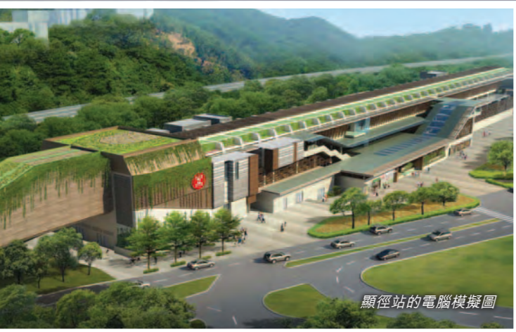
顯徑站的電腦模擬圖