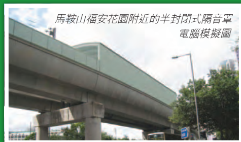
馬鞍山福安花園附近的半封閉式隔音罩 電腦模擬圖

根據環境保護署發出有關建造馬鞍山綫的「環境許可證」上的要求，為配合8卡車廂的列車運作，福安花園附近的高架軌道將須加建半封閉式隔音罩。工程會在非行車時間內進行，令列車運作不受影響。