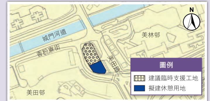
位於香粉寮街及美田路交界的政府空置土地

另外，我們建議將水泉澳其中一幅並未納入為公屋用地的土地用作臨時存放鑽石山前大磡村內的文物建築。待沙中綫工程完成後，這些文物建築會被運回前大磡村重置。