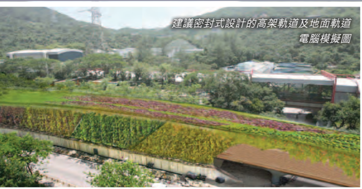
建議密封式設計的高架軌道及地面軌道電腦模擬圖

另外，為減低運送工程泥石對附近居民的影響，我們正研究在擬建的獅子山隧道入口（近顯徑邨）利用密封運輸帶，將泥石經沙田濾水廠旁的現有道路運走。