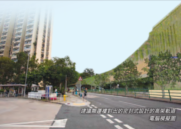
建議顯徑樓對出的密封式設計的高架軌道電腦模擬圖