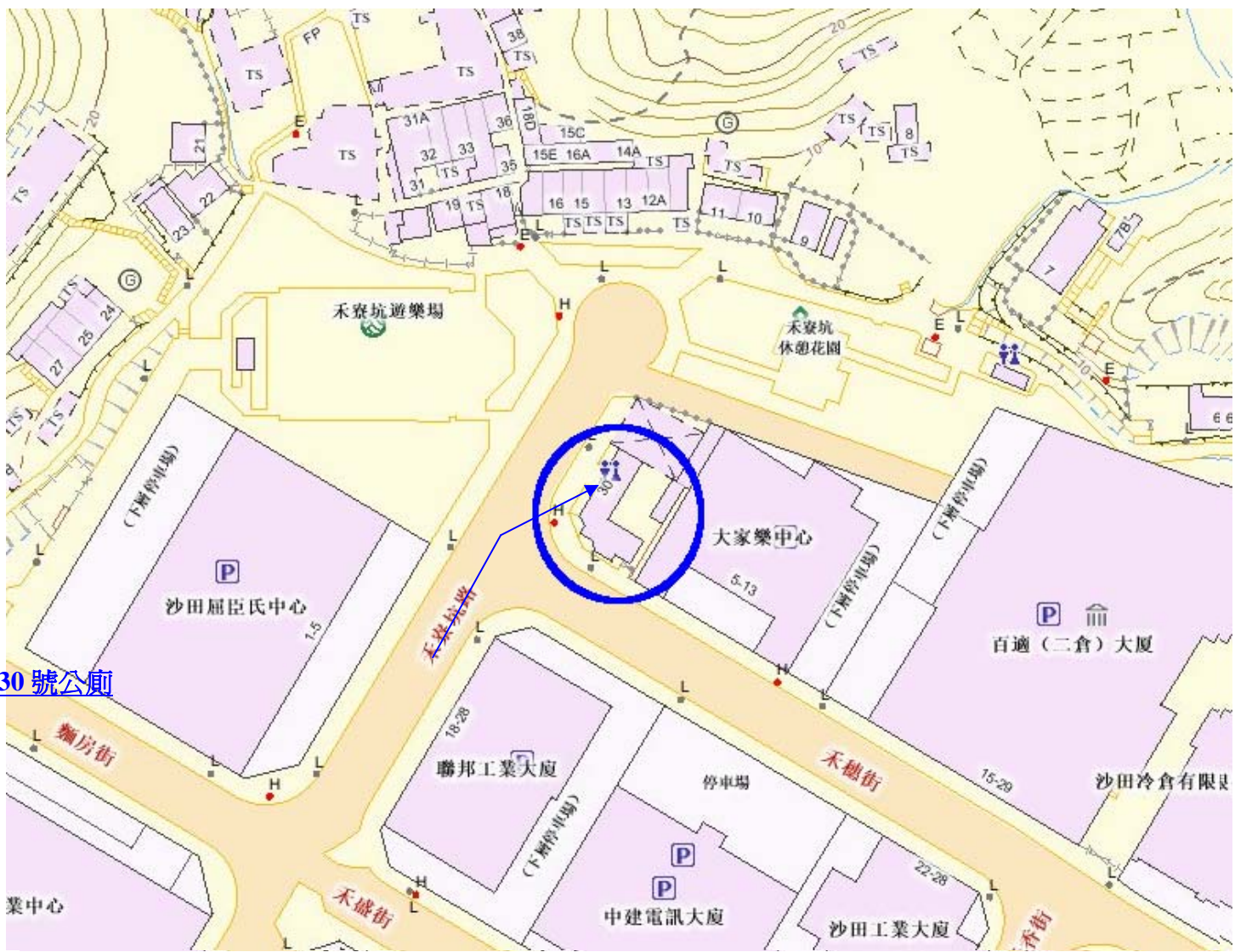
禾寮坑路 30 號公廁