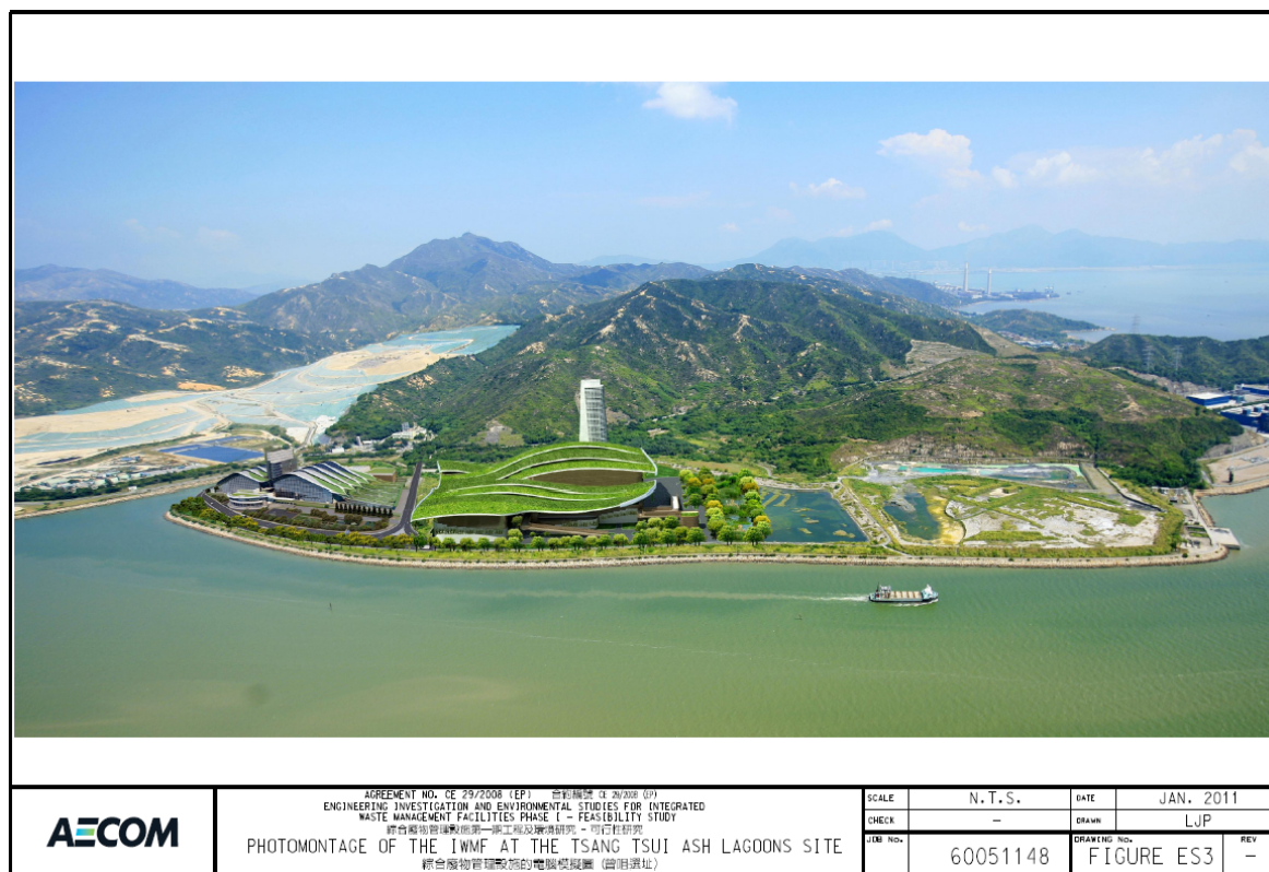
圖 2 – 綜合廢物管理設施第一期的電腦模擬圖 (曾咀煤灰湖)