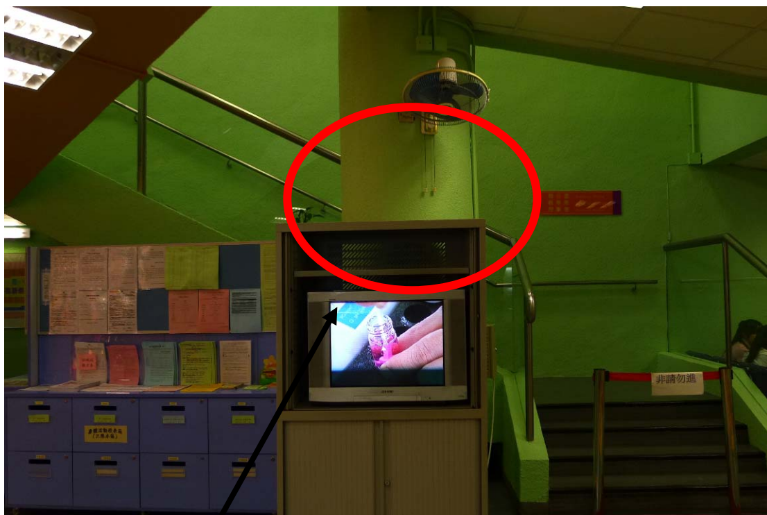
建議裝設電子顯示屏幕工程位置