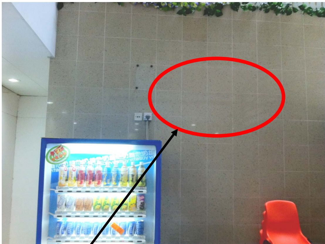
建議裝設電子顯示屏幕工程位置