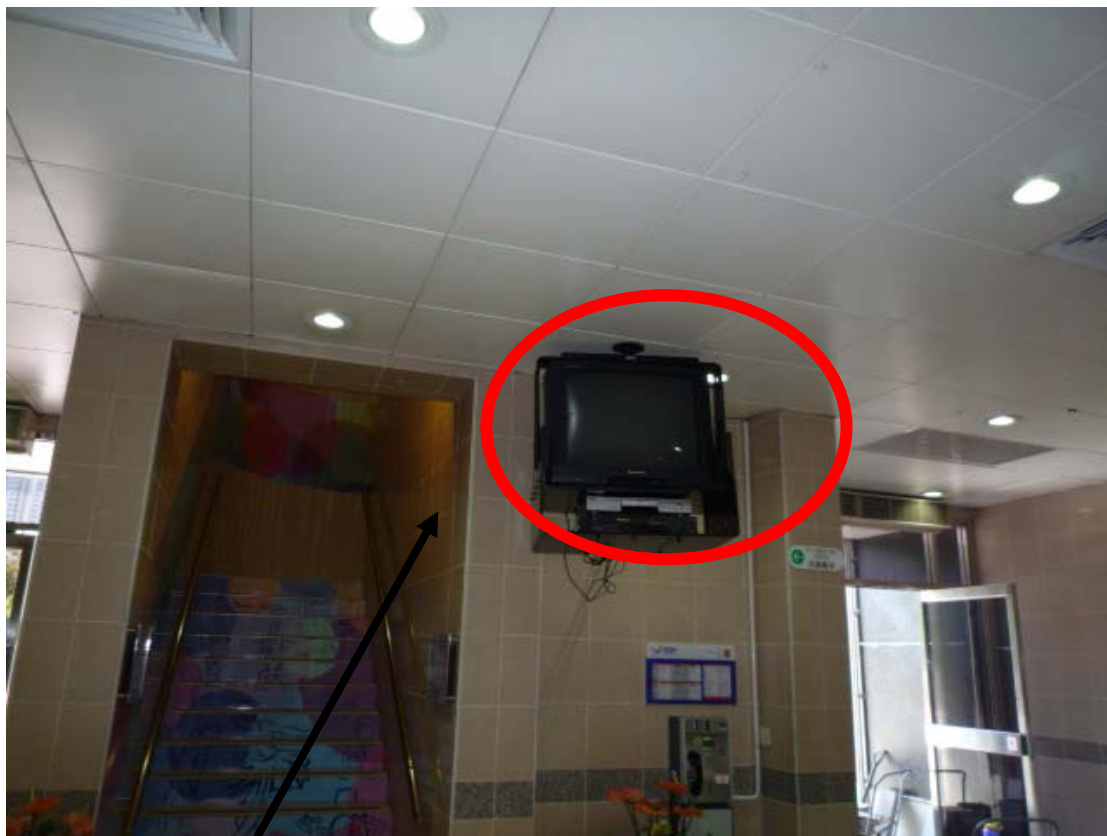
建議裝設電子顯示屏幕工程位置