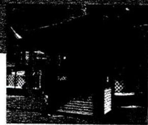
旅遊資訊亭 (位置特定)