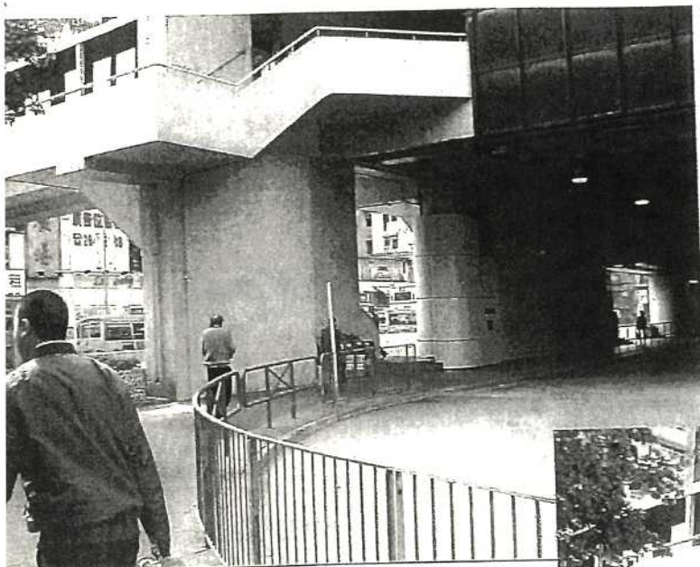
巴士乘客落車後需行樓梯往荃灣 兩豐中心及路德圍，十分辛苦。