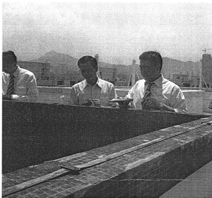
綠楊新邨 F 座天台(量度噪音位置)