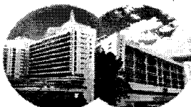
Ruttonjee & Tang Shiu Kin Hospitals 律敦治及鄧肇堅醫院

Population served ~830,000 (>70% are residents of the Eastern District) 服務區內約83萬人口(超過70%為東區居民)