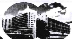
Ruttonjee & Tang Shiu Kin Hospitals 律敦治及鄧肇堅醫院

Population served ~820,000 (>70% are residents of the Eastern District) 服務區內約82萬人口(超過70%為東區居民)