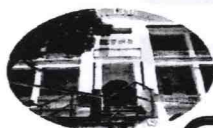
St. John Hospital 長洲醫院