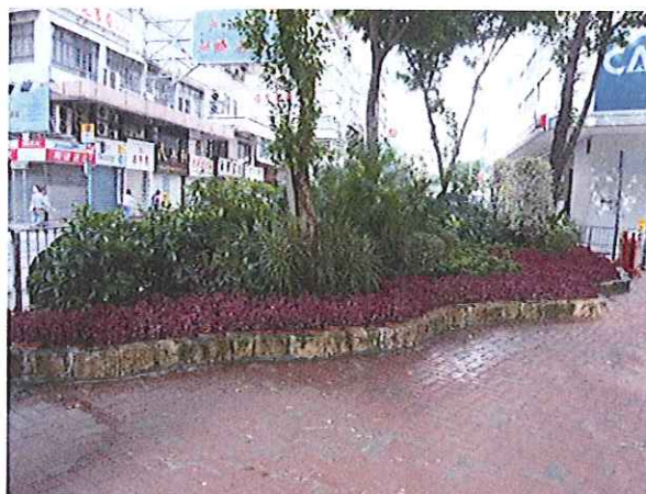
(2) 軒尼詩道/莊士敦道休憩處