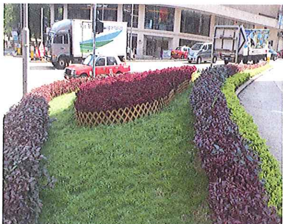
(3) 皇后大道東/摩理臣山道小園地