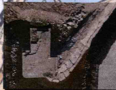
石橋末端及前海堤 Bridge End and Old Seawall