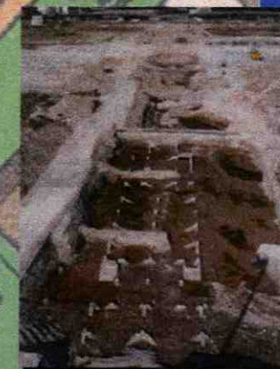
前九龍城碼頭 Old Kowloon City Pier

啓德分區計劃大綱圖(圖則編號S/K22/2)上的石橋遺址位置 The Bridge Site on Kai Tak Outline Zoning Plan (Plan No. S/K22/2)