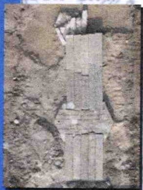
龍津石橋 Lung Tsun Stone Bridge