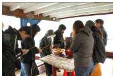
進行簡單悼念儀式