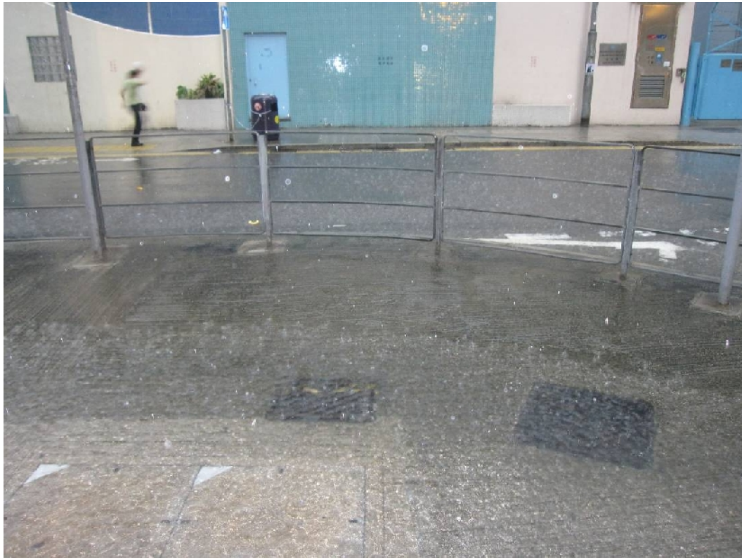
圖組六： 晏架街及槐樹街交界