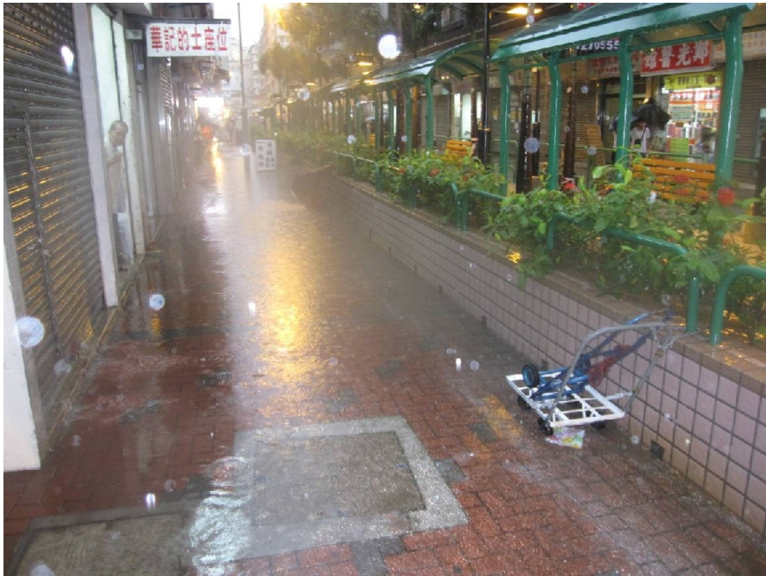
圖組二： 鐵樹街休憩處，近金堂閣位置