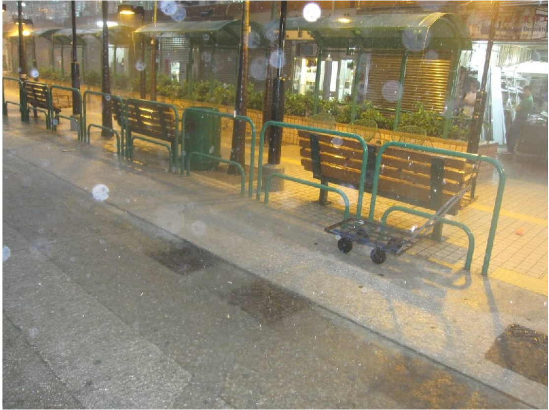
圖組三： 大角咀道及福澤街交界