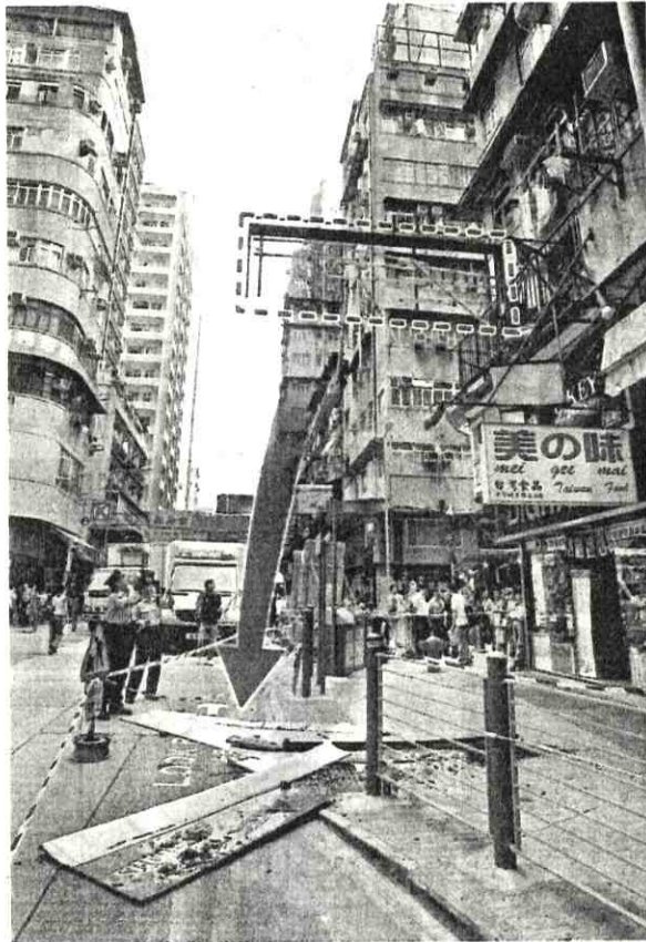
招牌塌下後，支架仍在半空搖搖欲墜（紅框示）。