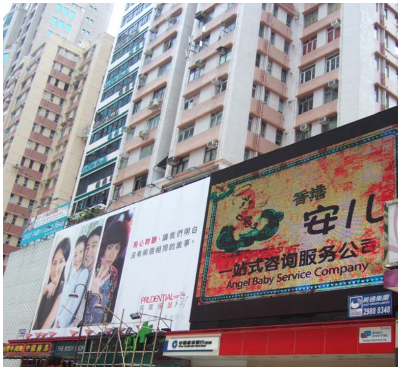
(圖 1) 很多大廈外牆有密封式巨型招牌設置