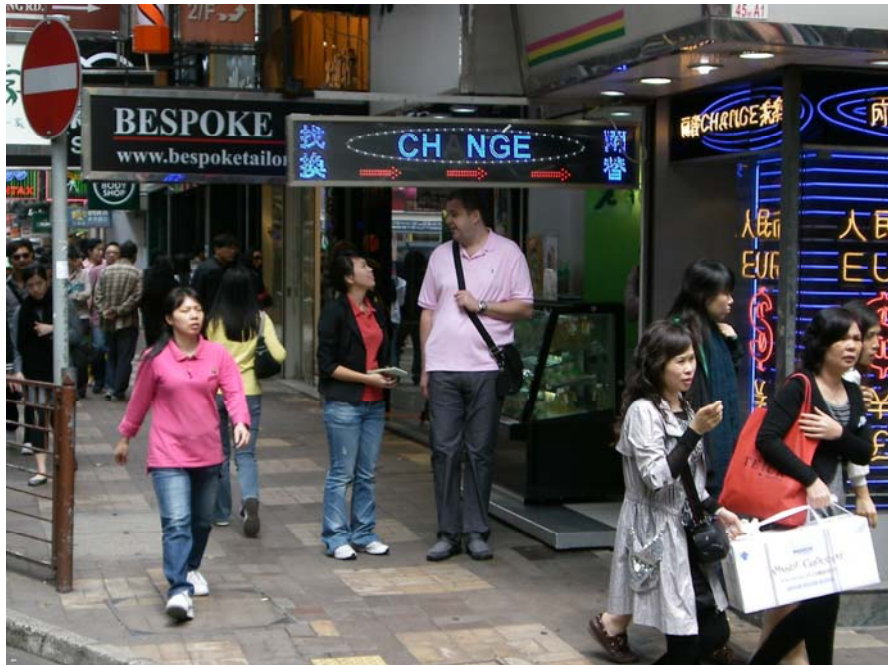
(圖 2) 區內不少招牌離地面高度不足，行人稍一不慎會撞倒。