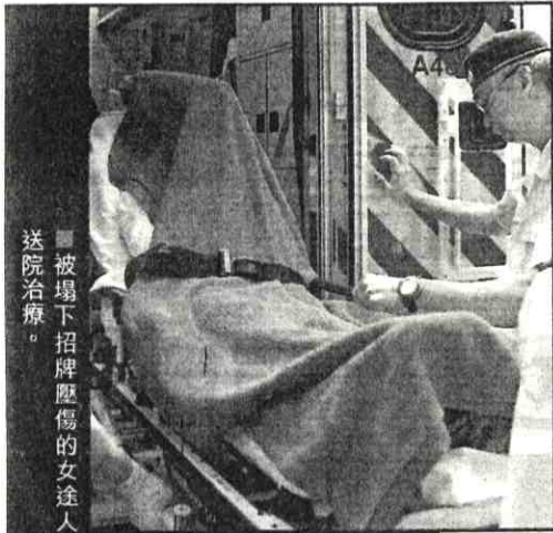
被塌下招牌壓傷的女途人送院治療。