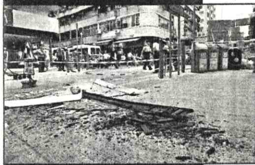
招牌墮地粉碎，碎片四散，鐵枝鏽蝕明顯。