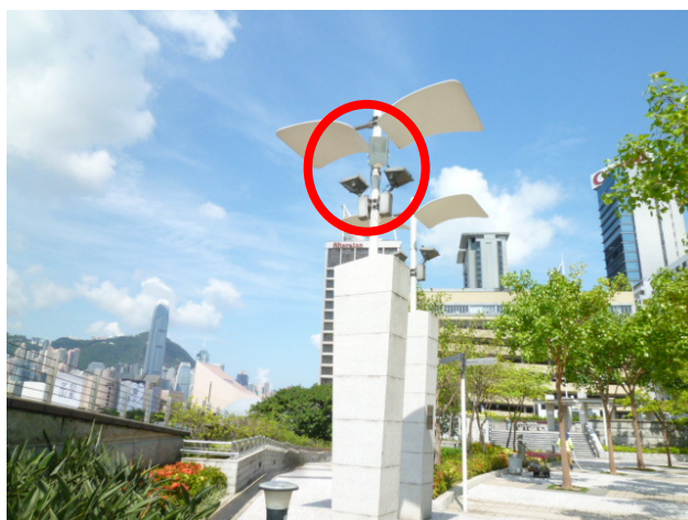
傷健斜路泛光燈柱頂