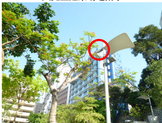
細兒童遊樂場泛光燈柱