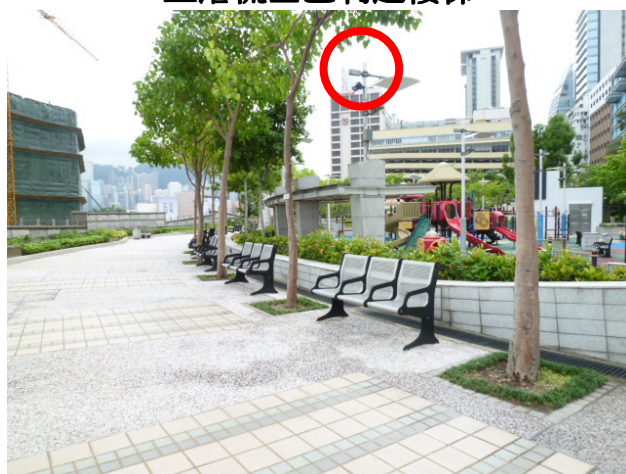
大兒童遊樂場避雨亭