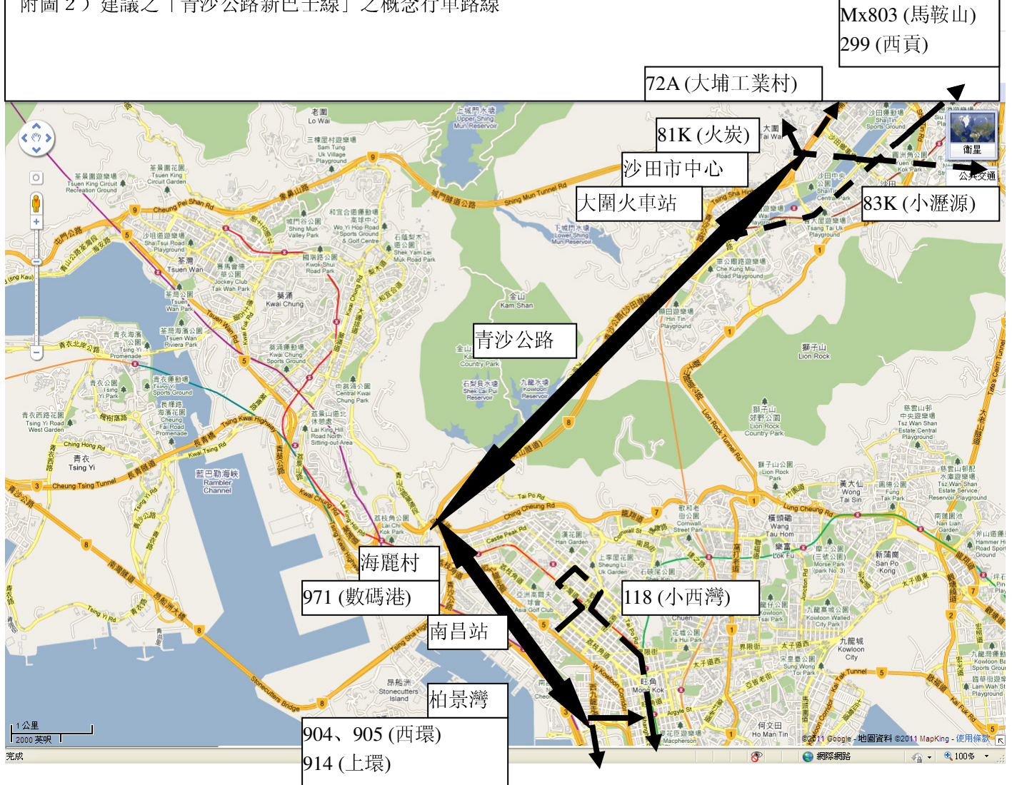
附圖 2) 建議之「青沙公路新巴士線」之概念行車路線

電郵/MSN: waikeungchan@hotmail.com 傳真：2626 1079