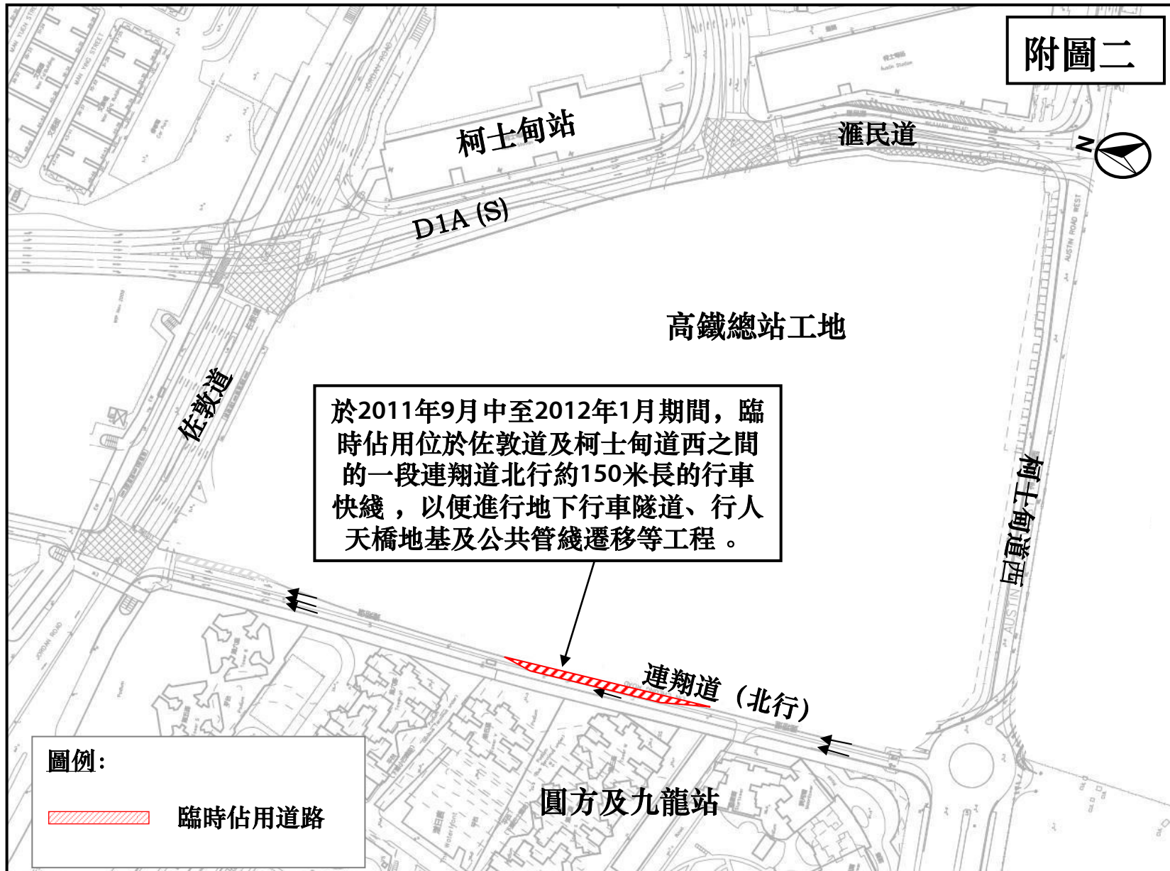
連翔道北行車綫臨時交通改道措施 (預計於2011年9月中至2012年1月期間實施)