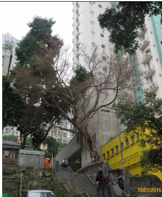
於 2016 年 1 月 19 日檢查時的狀況〈圖三〉