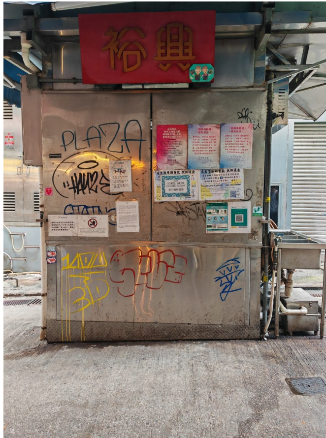
18STS CF0012 大牌檔 位於中環士丹利街皇后大道中 122-126 後 「裕興」