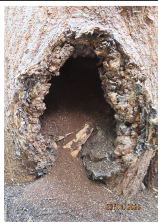
圖片 9: T810 樹根狀況 - 根部有因白蟻造成的大型空洞，尺寸為長 10 厘米 x 闊 10 厘米 x 深 40 厘米