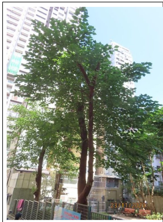
圖片 2: T804 樹木外觀