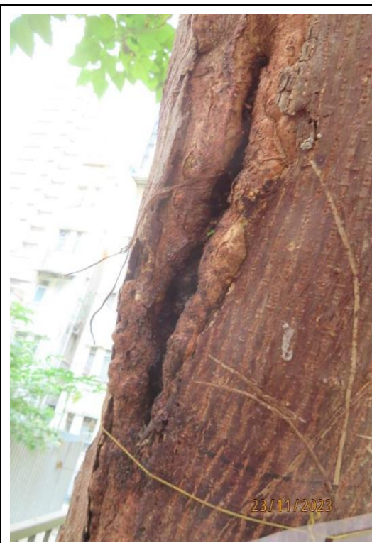
圖片 3: T804 主幹狀況 - 大範圍傷痕