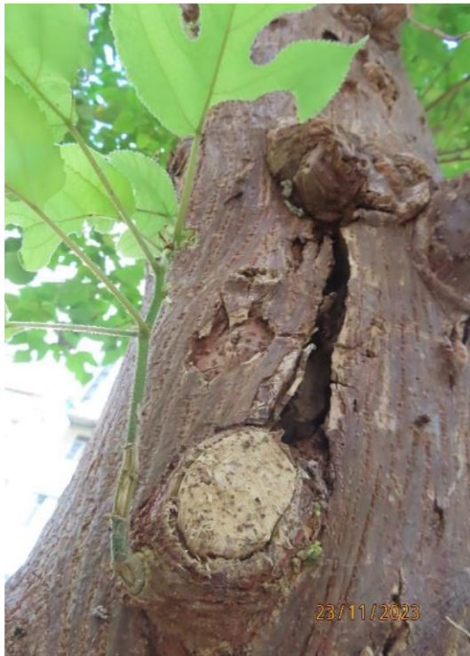
圖片 4: T804 樹枝狀況 - 枯木及不尋常裂縫