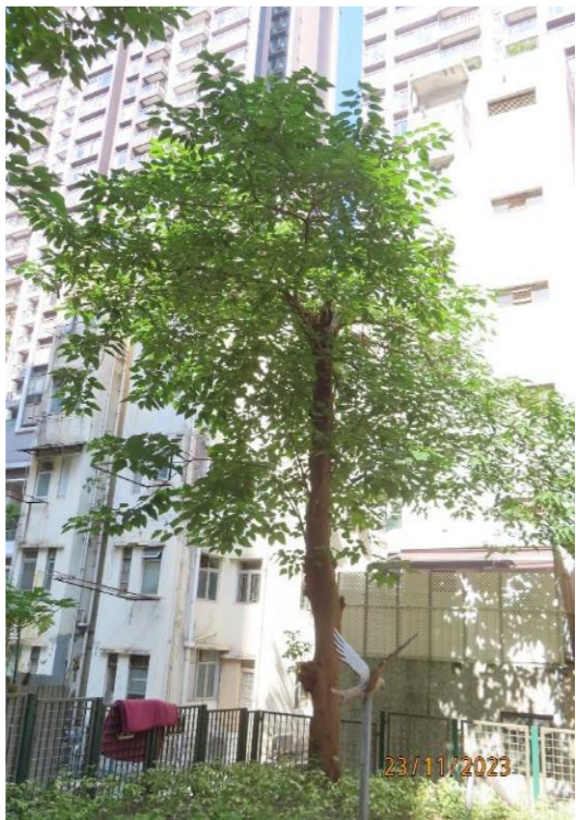
圖片 6: T810 樹木外觀