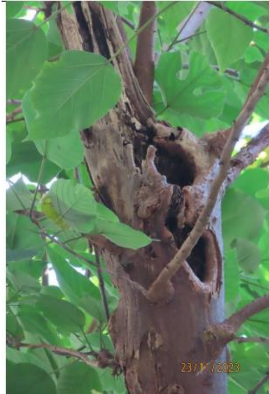
圖片 5: T804 樹枝狀況 - 有枯木及樹枝裂開