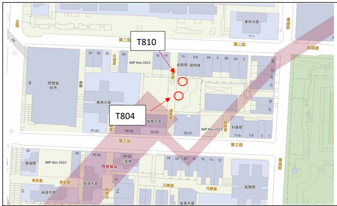
圖片 1: 樹木位置