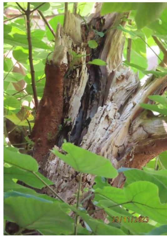
圖片 7: T810 樹冠狀況 - 樹枝腐爛及有枯木外露