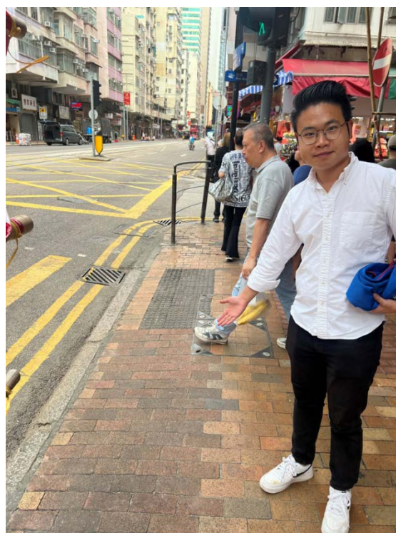
15. 正街及德輔道西交界「錢大媽」對出的行人過路處