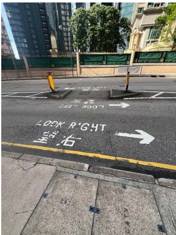
1. 近燈柱編號 38435 對出的安全島