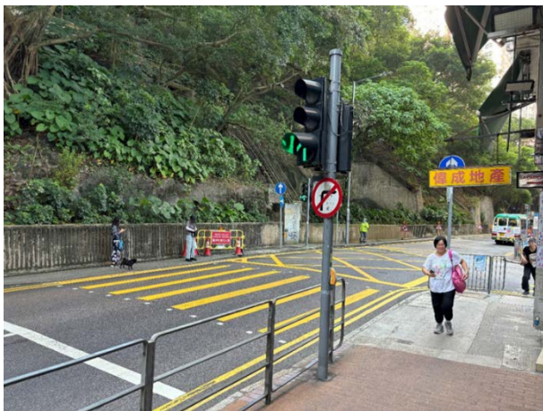
11. 卑路乍街右轉西祥街對出的行人過路處