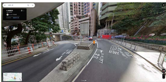
3. 羅便臣道 95 號對出的行人過路處