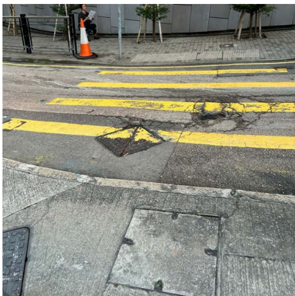
12. 衛城道及西摩道交界的行人過路處