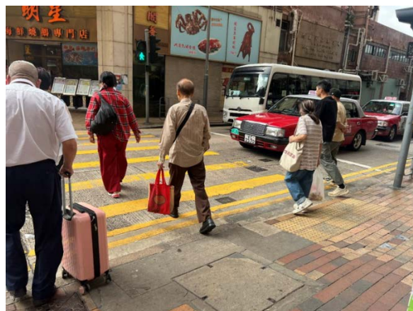
13. 德輔道西 271 號「明星海鮮酒樓」門口對出的行人過路處