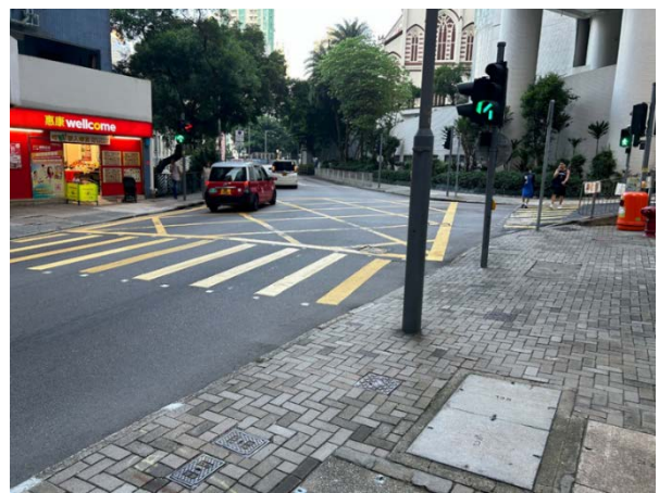
10. 卑利士道及般咸道交界的行人過路處