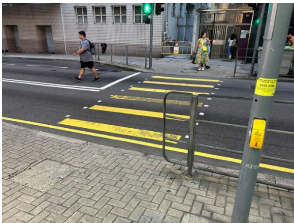
9. 堅道 47 號對出的行人過路處