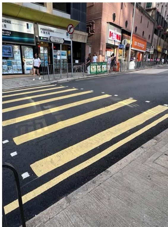
2. 近燈柱編號 50956 對出的的行人過路處