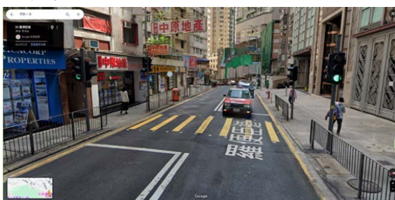
5. 羅便臣道 35 號對出的行人過路處