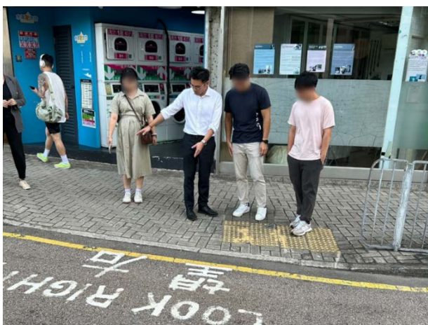
16. 般咸道 38 號的行人過路處