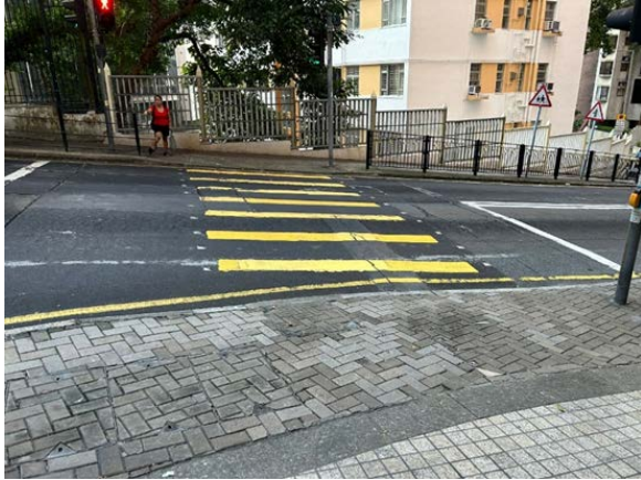
7. 柏道 2 號對出的行人過路處