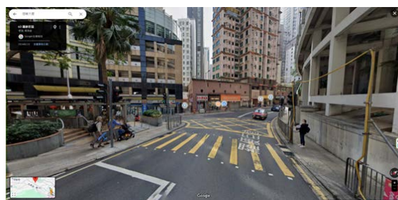
4. 羅便臣道 60 號對出的的行人過路處