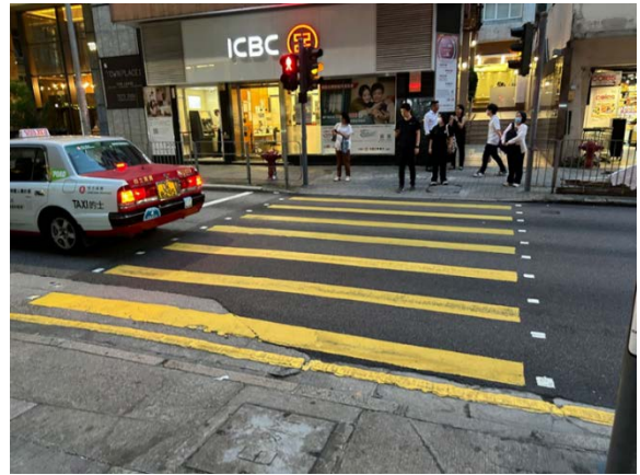
8. 堅道 27 號對出的行人過路處