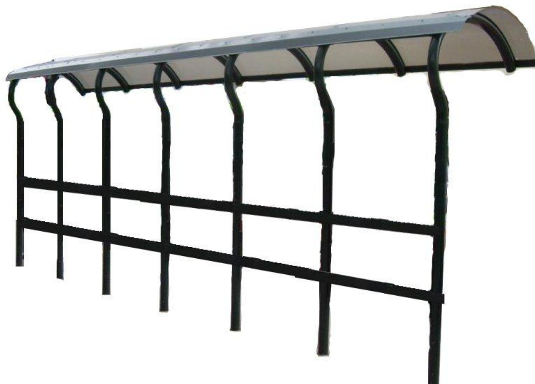
設置的避雨上蓋款式