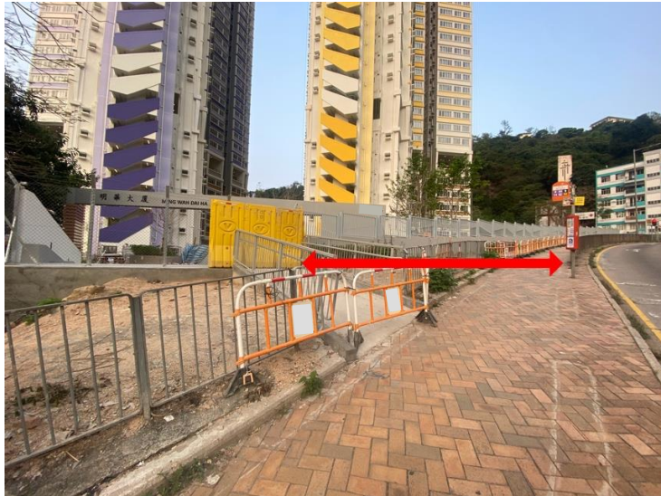
圖一：柴灣道近明華大廈往小西灣方向巴士站