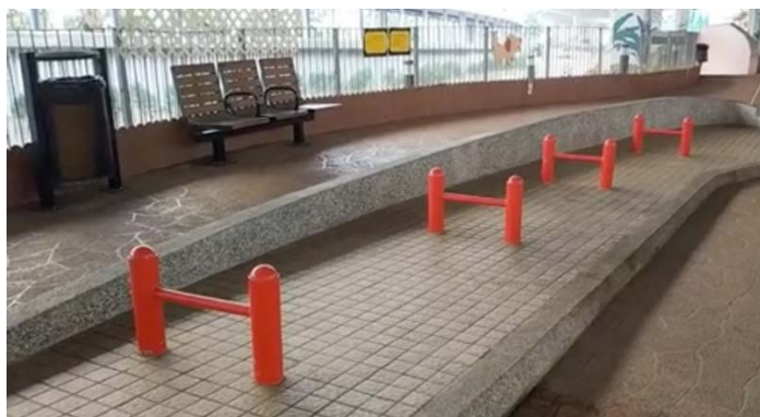
附圖十：東喜道休憩處