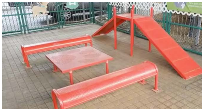
附圖九：東喜道休憩處