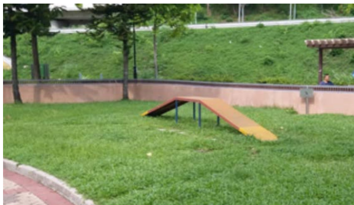
附圖七：屯門海皇路花園