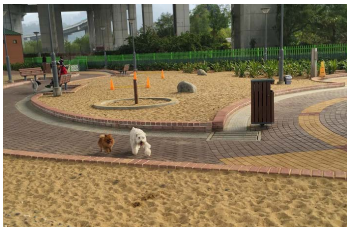
附圖八：藍地寵物公園