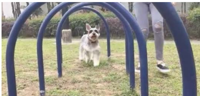
附圖六：屯門海皇路花園