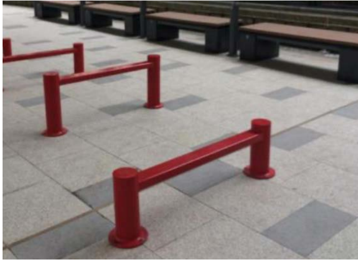
附圖十二：康祥街休憩處