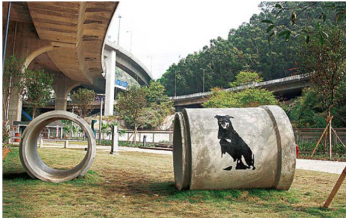
附圖二：蝴蝶谷道寵物公園