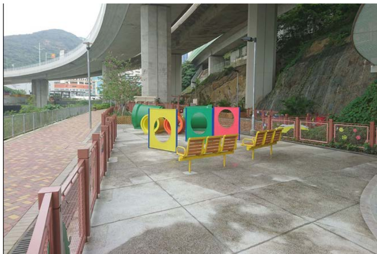
附圖五：蝴蝶谷道寵物公園