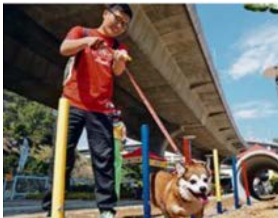
附圖三：蝴蝶谷道寵物公園