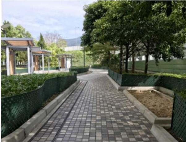
附圖一：東涌北寵物公園