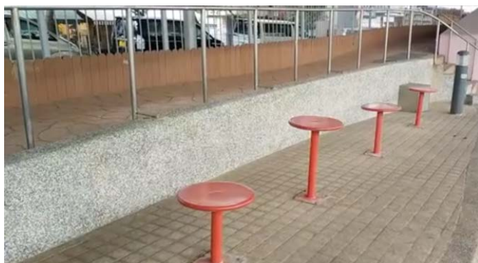
附圖十一：東喜道休憩處