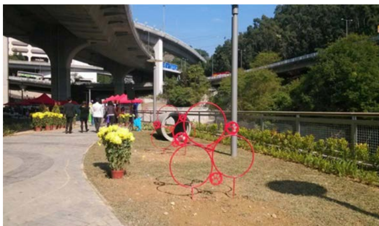
附圖四：蝴蝶谷道寵物公園