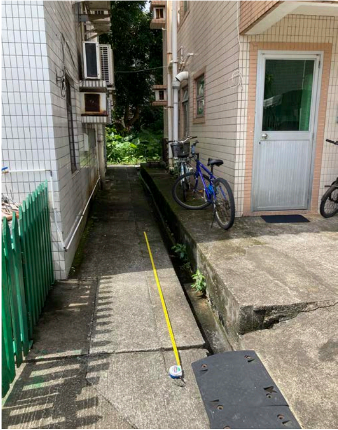
附圖二：現有排水渠狀況