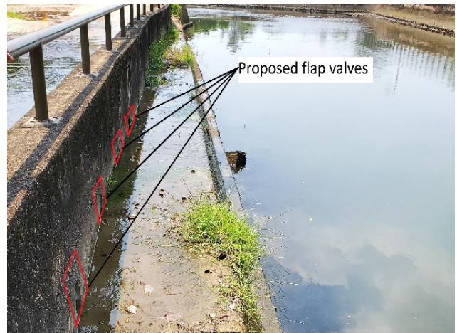
附圖四及五：擬設置止回閥的款式