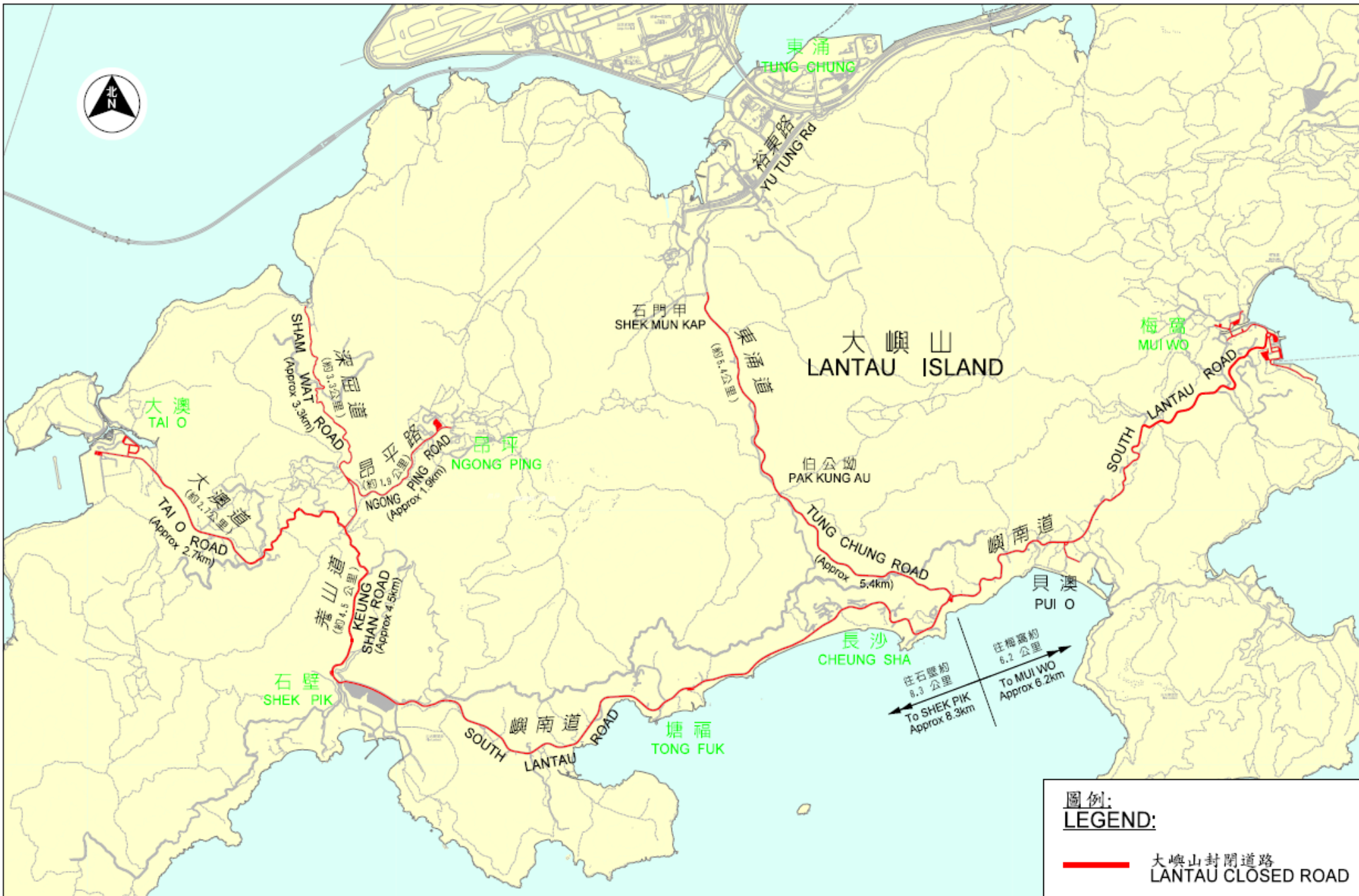
大嶼山封閉道路 LANTAU CLOSED ROAD