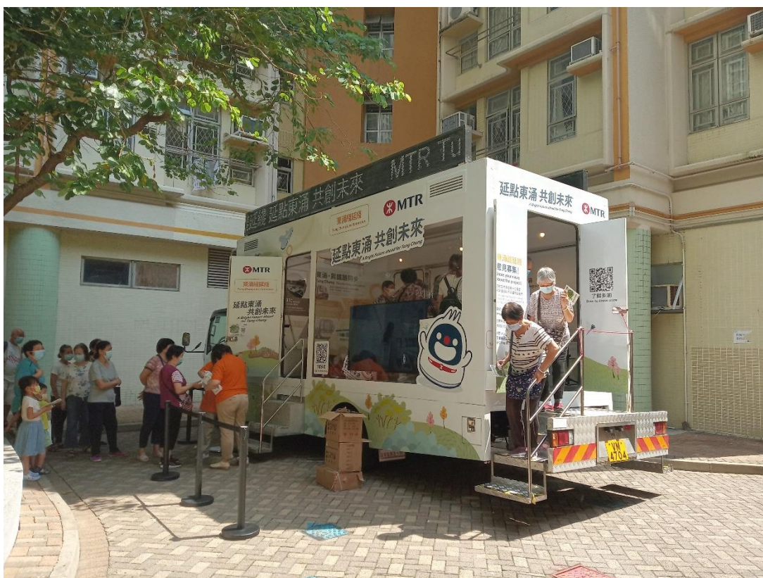
東涌線延線項目宣傳車