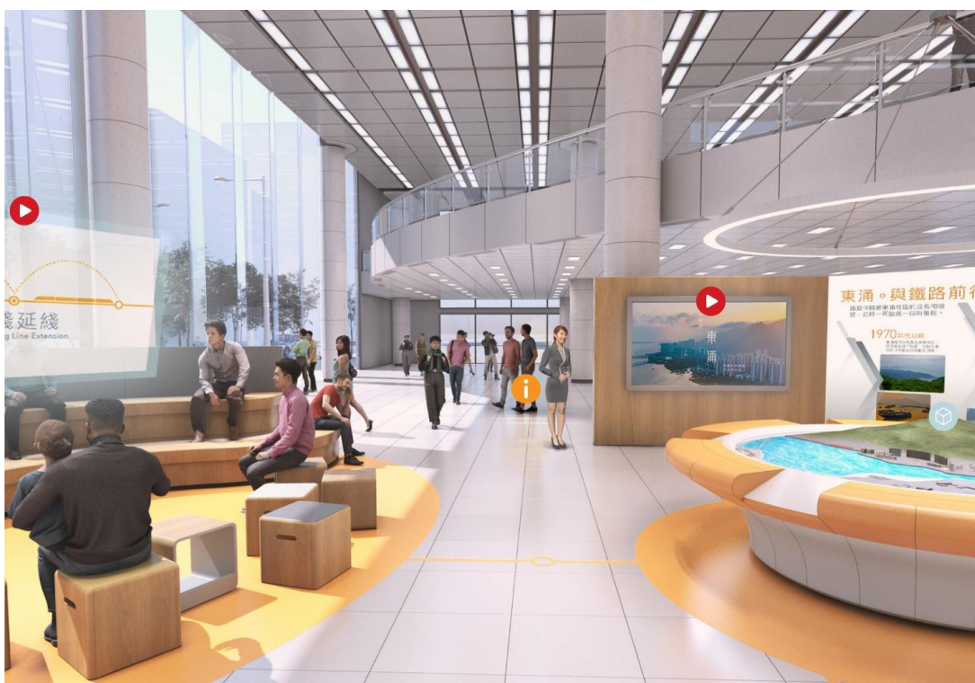
東涌線延線項目網上虛擬資訊中心