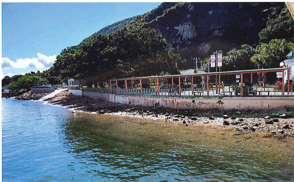
索罟灣二號碼頭附近地台擬建造混凝土牆的位置