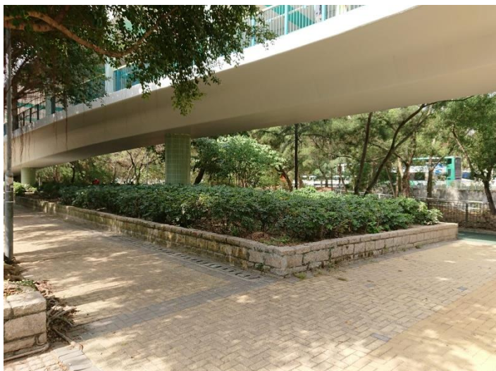
附圖 1 及 2