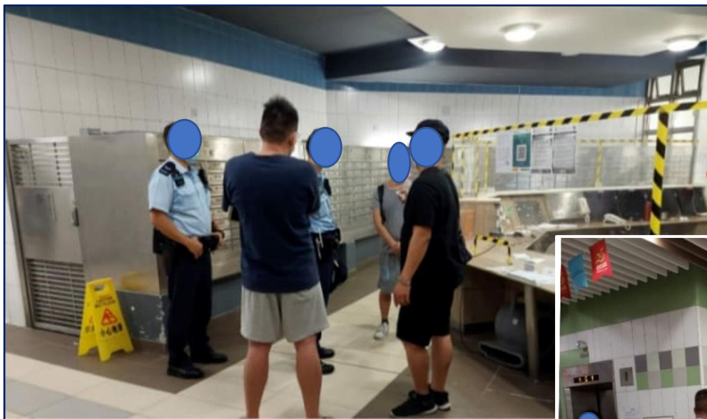
警員截查派私煙單張人士