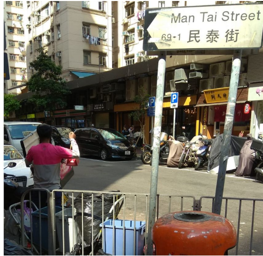
1. 德民街民泰街街口