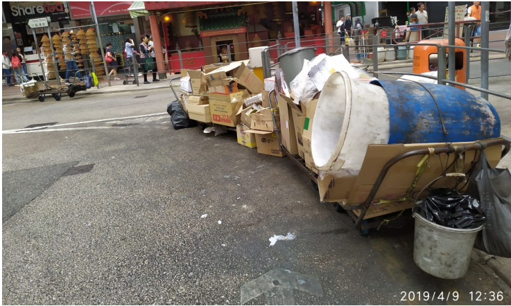
5. 寶其利街寶來街轉彎角