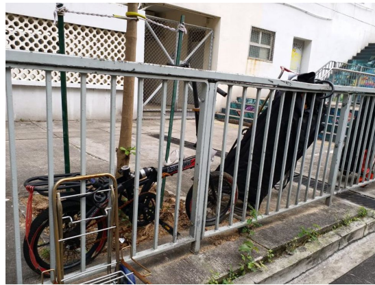
3. 黃埔新邨可榮樓旁行人路