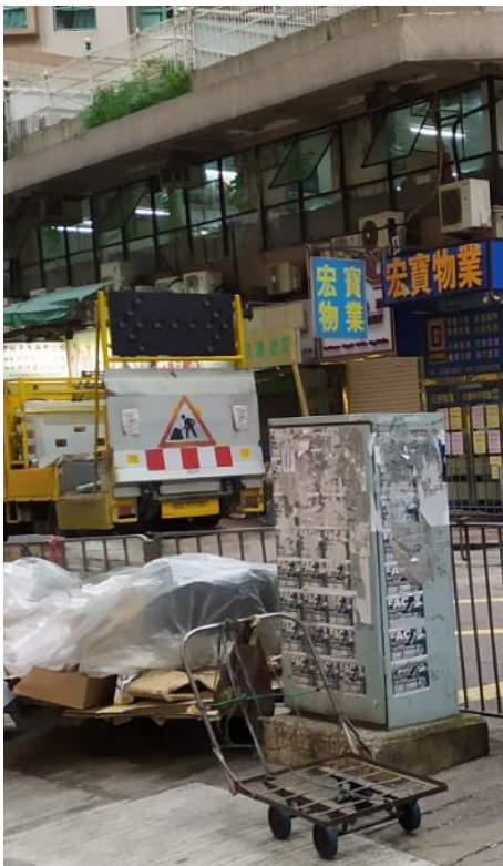
6. 寶其利街湖光街交界利人路