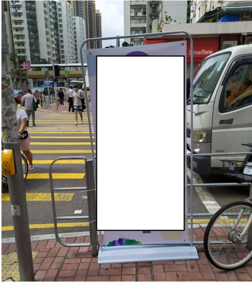
2. 德民街黃埔港鐵站A出口