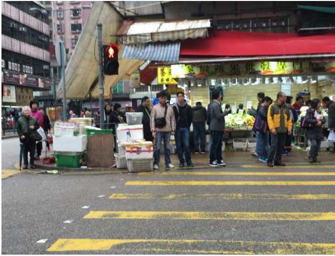
馬頭圍道與差館里交界