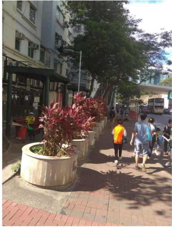
紅磡道民兆街交界