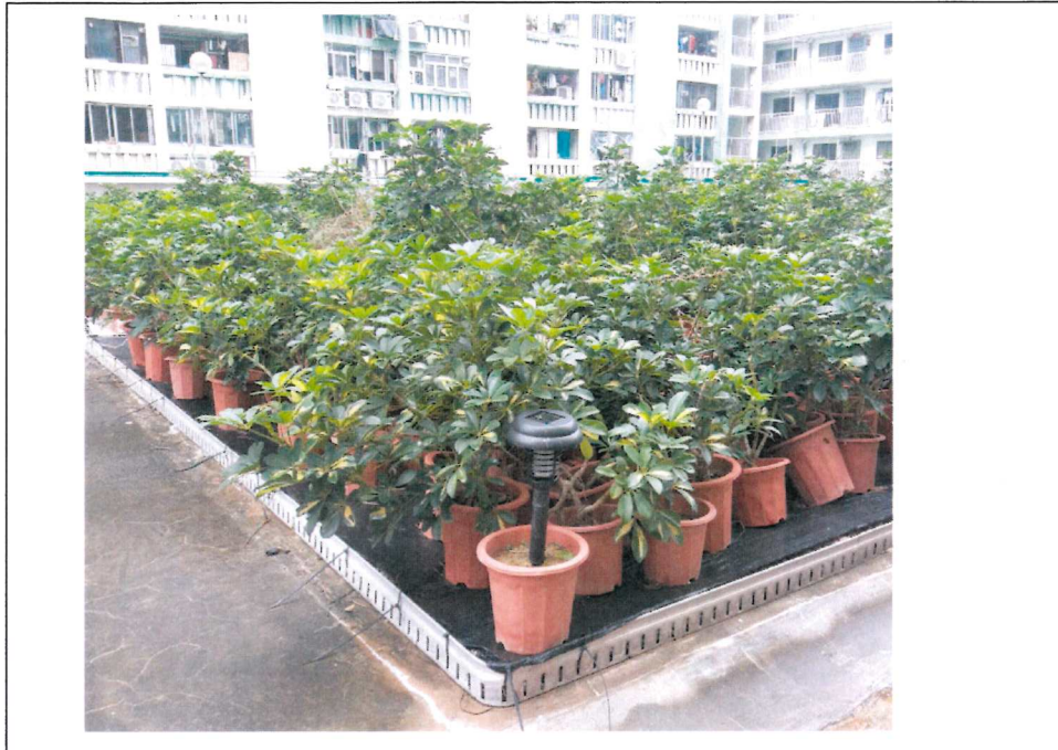
已在愛民街市加裝滅蚊燈