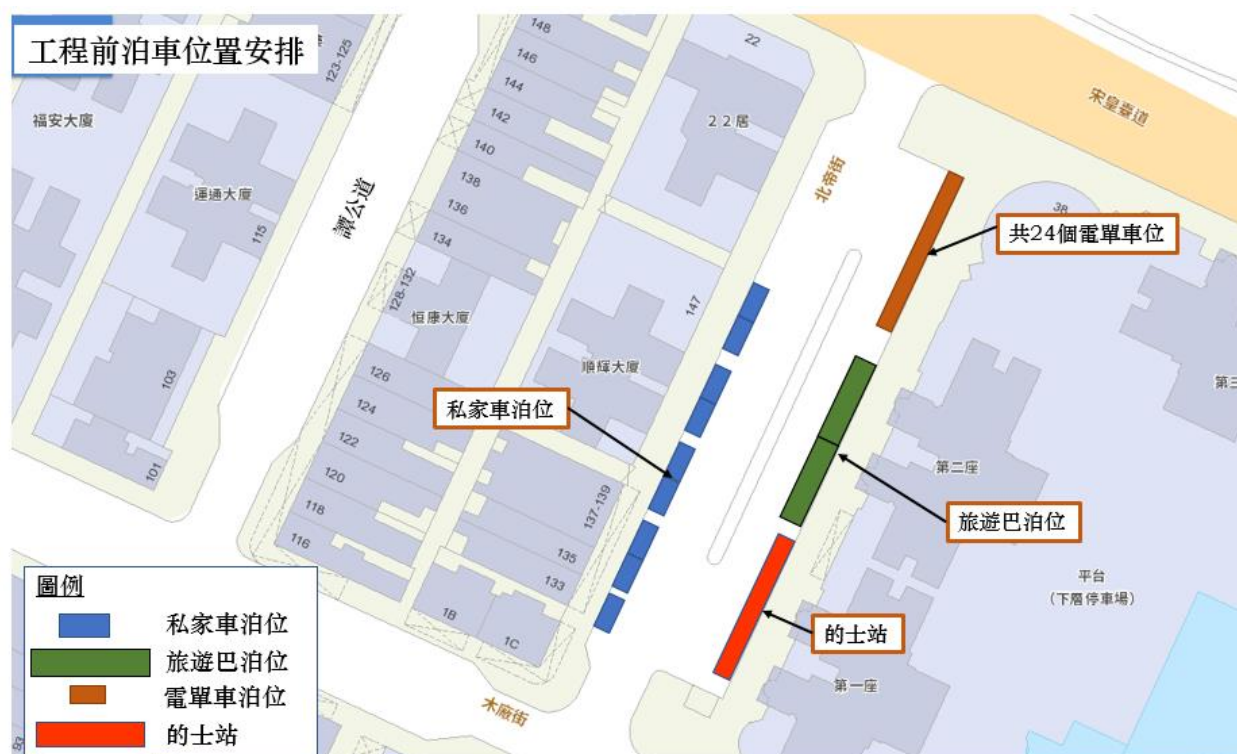
工程前泊車位置安排