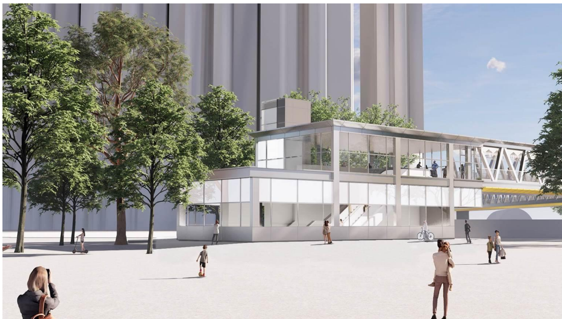
宋皇臺站擬建 C 出口行人天橋