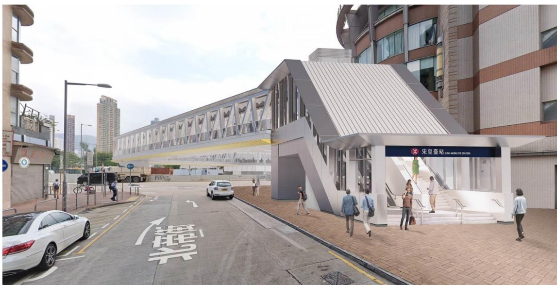
擬建行人天橋北帝街出入口