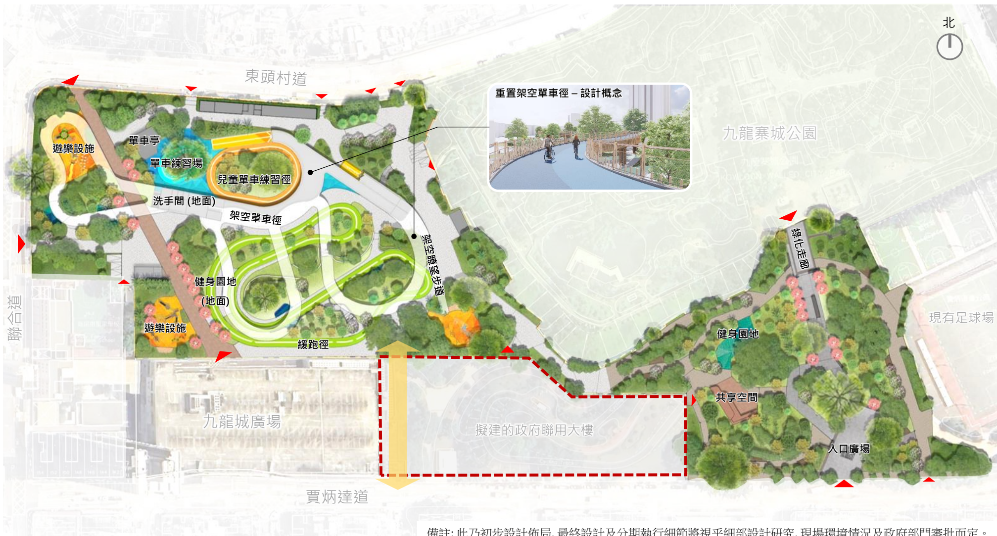
圖一：賈炳達道公園設計平面圖

備註：此乃初步設計佈局，最終設計及分期執行細節將視乎細部設計研究，現場環境情況及政府部門審批而定。