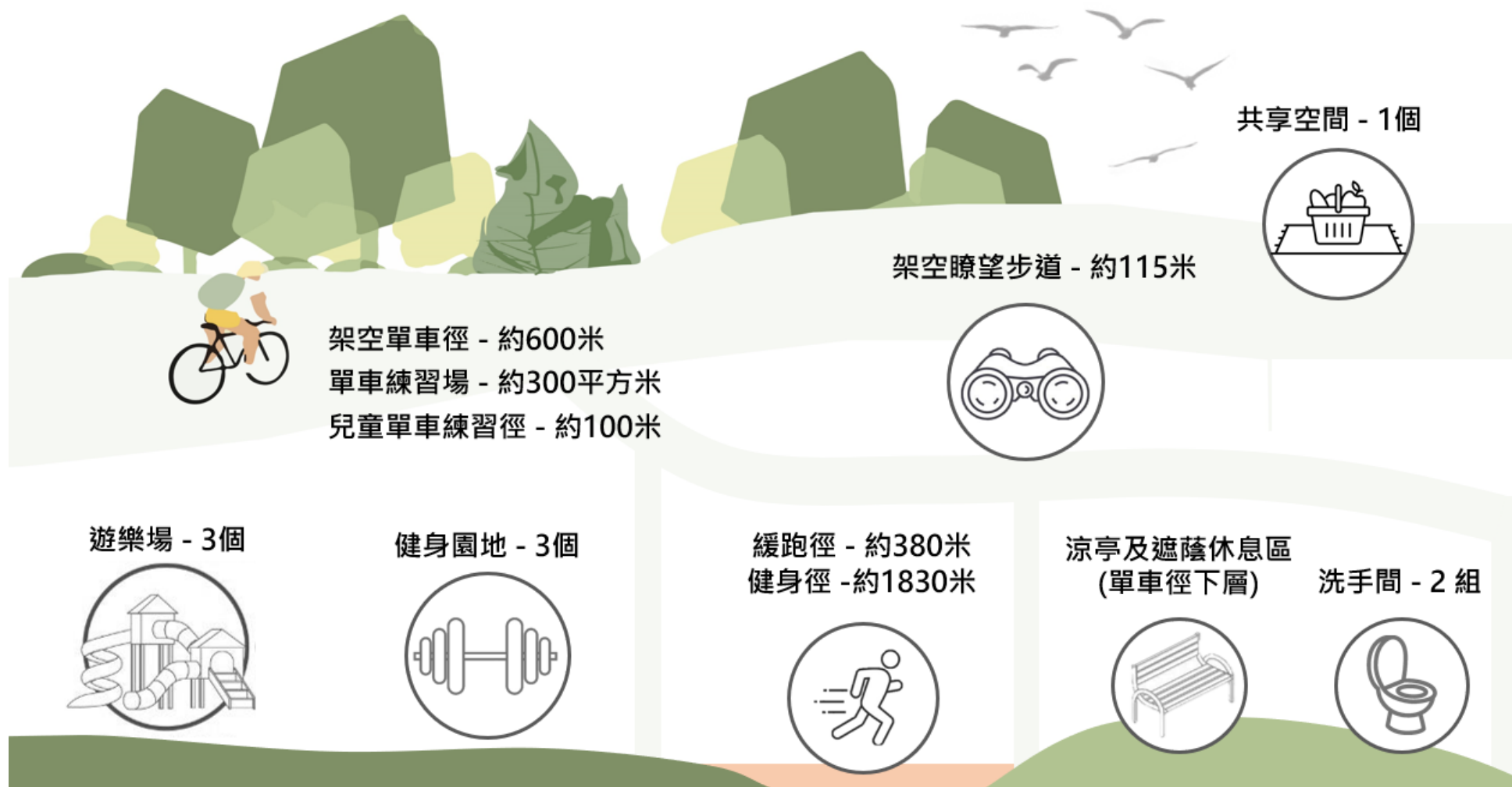
圖三：賈炳達道公園更新活化後的主要設施