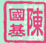
(陳國基) 觀塘警區指揮官

儘管環境迅速轉變，我深信只要各人員同心協力，再加上社會各界的鼎力支持，我們必定能夠繼續維持觀塘警區的安全和穩定，讓廣大市民都能夠安居樂業。