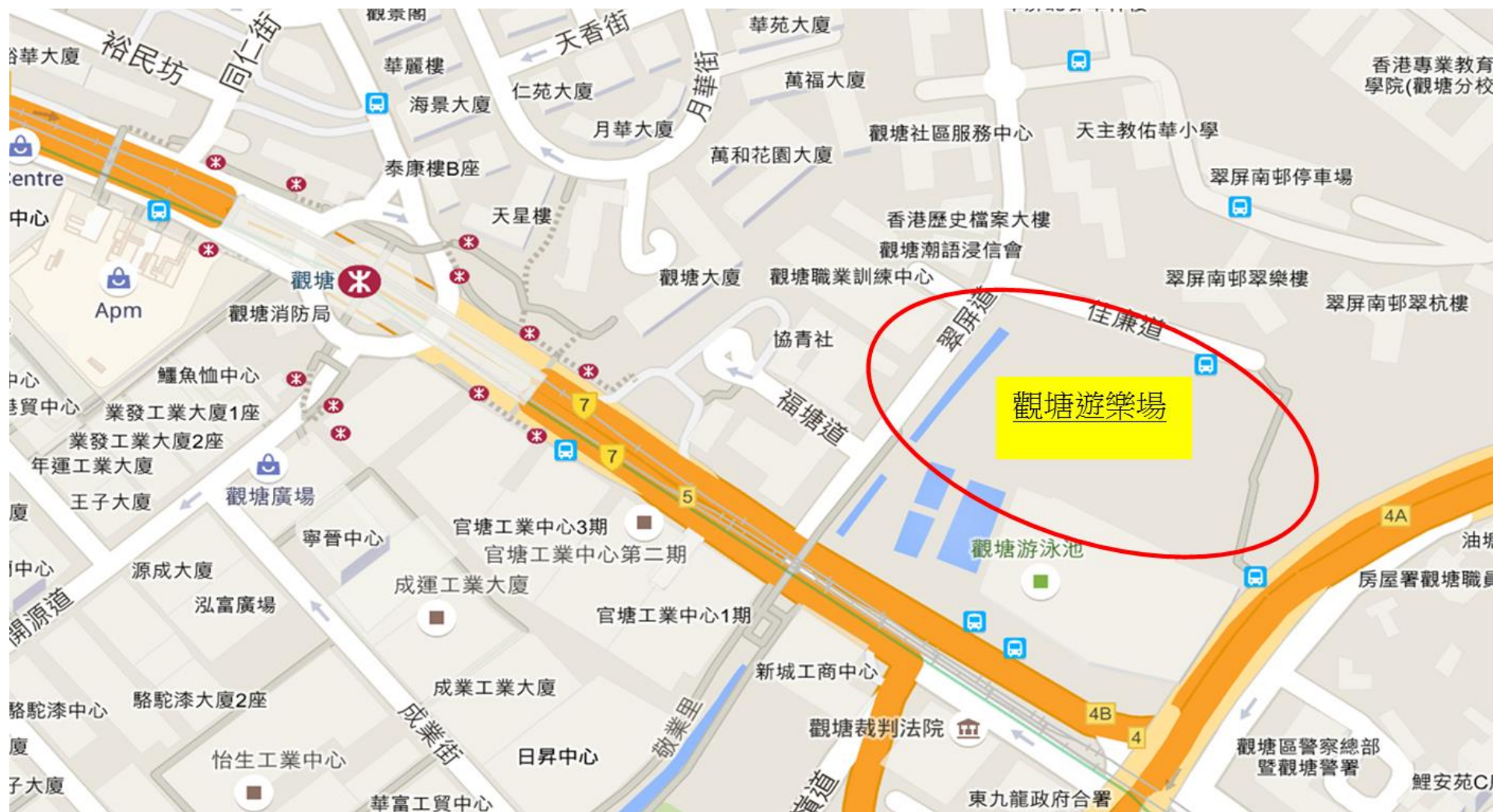
觀塘遊樂場位置圖