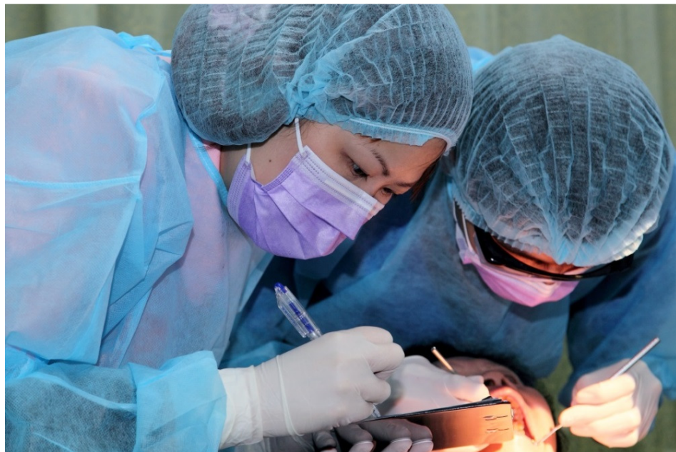
本院牙科醫生及牙科助護專業用心地提供牙科外展服務

本院牙科外展服務除參與由政府資助的牙科外展計劃外，更與不同的社區機構合作如電台、學校、院舍、長者日間中心、長者地區中心、綜合服務中心，弱能人士宿舍及工場等，透過提供口腔護理知識分享、口腔健康講座及口腔檢查等活動，用身體力行的方法喚醒市民對口腔健康的關注。