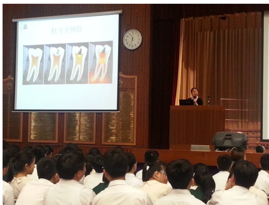
本院牙科醫生為中學生講解常見的口腔疾病及預防方式， 同學們均全神貫注地聆聽