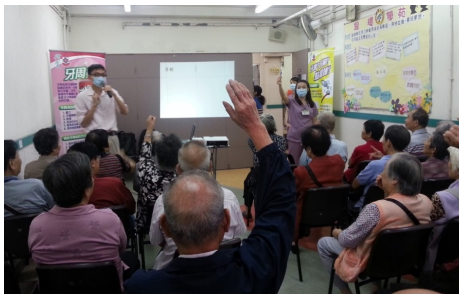
長者於口腔護理講座中積極參與，向牙科醫生查詢有關常見的口腔問題