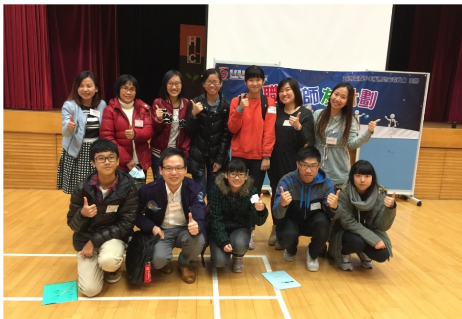
本院牙科服務參與由社會福利署舉辦之「職場師友計劃」， 安排同學到本院牙科診所進行工作體驗