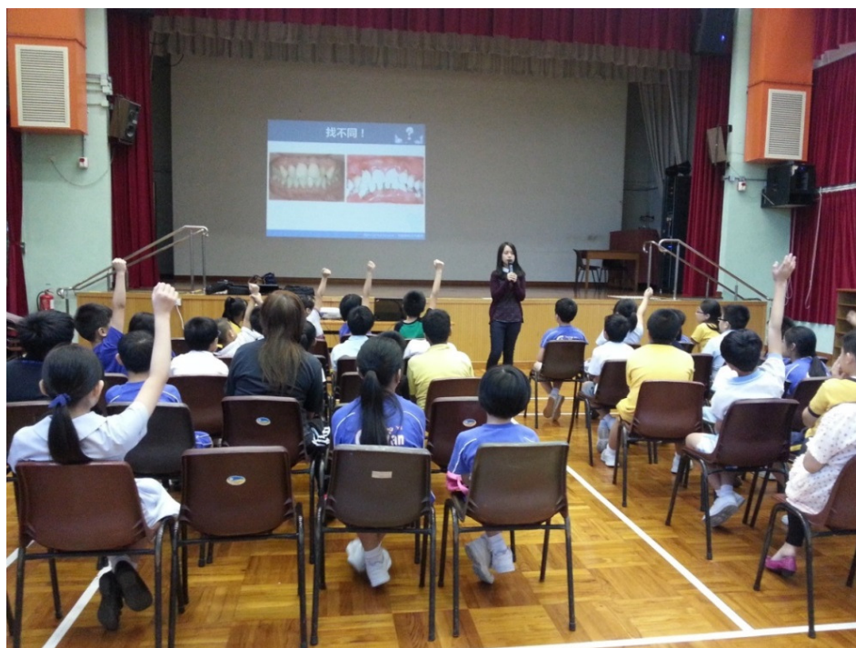
本院牙科醫生為小學同學提供口腔護理講座，同學們積極參與，踴躍發問