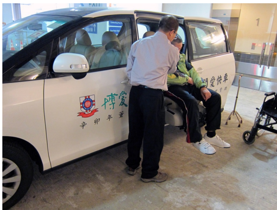
本院之「醫護關愛快車」為有需要長者提供免費接送服務