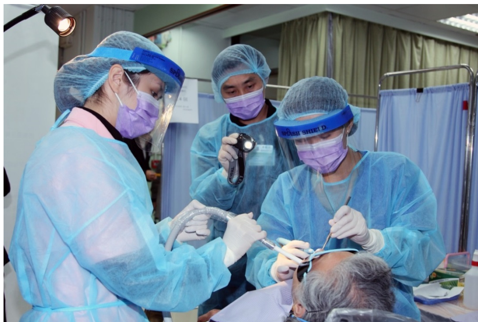
除口腔檢查外，本院牙科外展隊會因應長者的需要，提供有關跟進服務