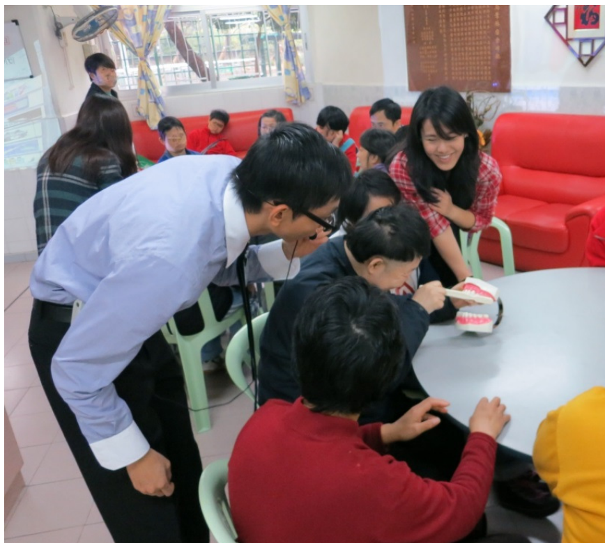
本院牙科醫生親身教授護理口腔的技巧，讓活動參加者可即時實習