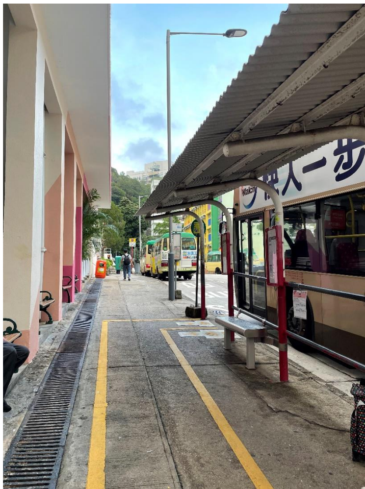
於祖堯坊往美孚方向未有設置巴士班次顯示屏 (攝於 17/5/2023 下午)