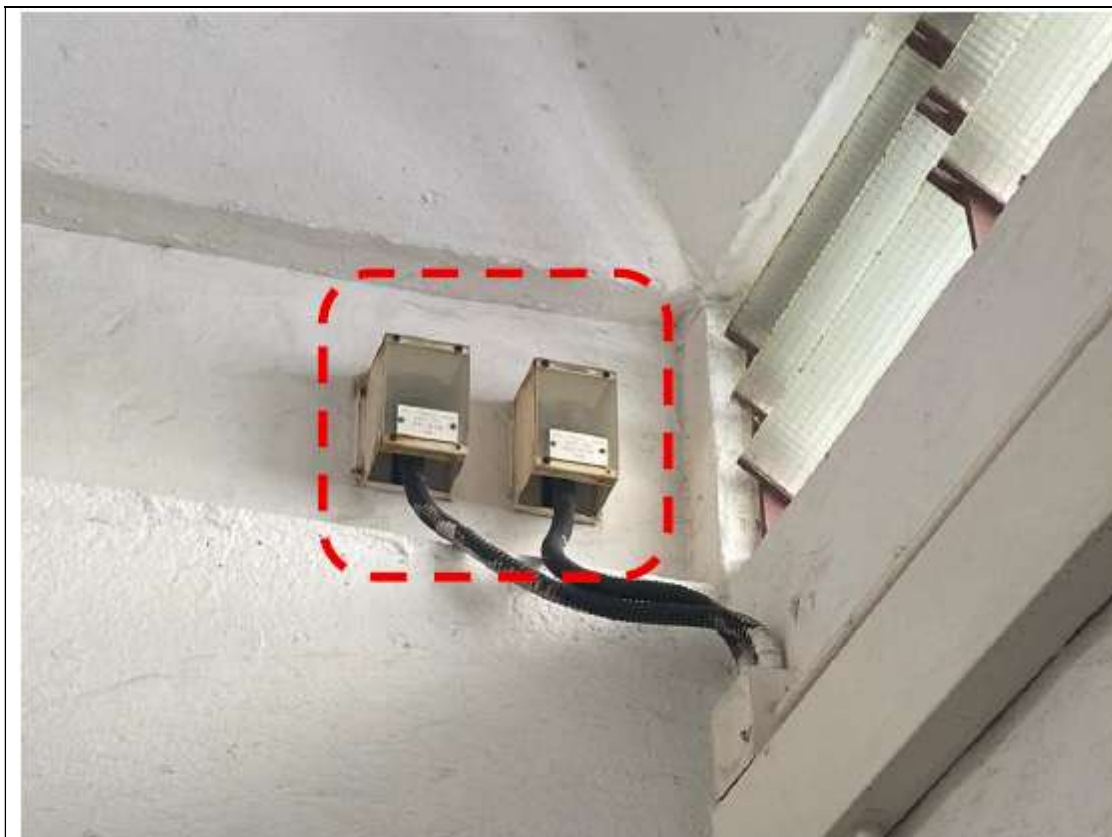
圖 4：光感感應器 (photo sensors)