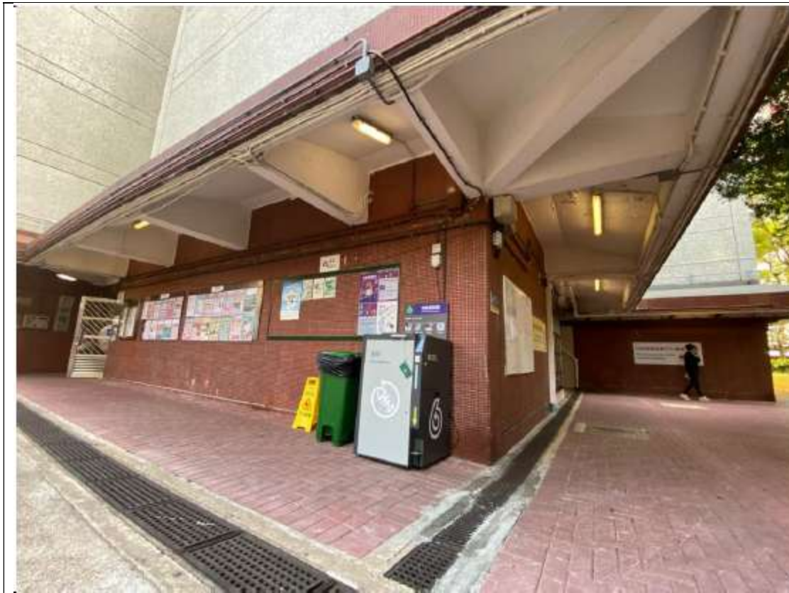
圖 3：公眾地方的照明