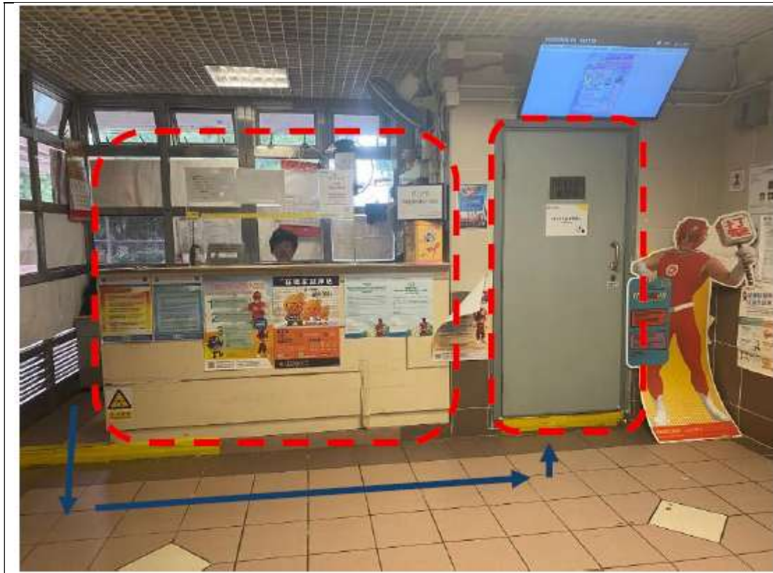
圖 1：地下大堂當值管理員和電掣房