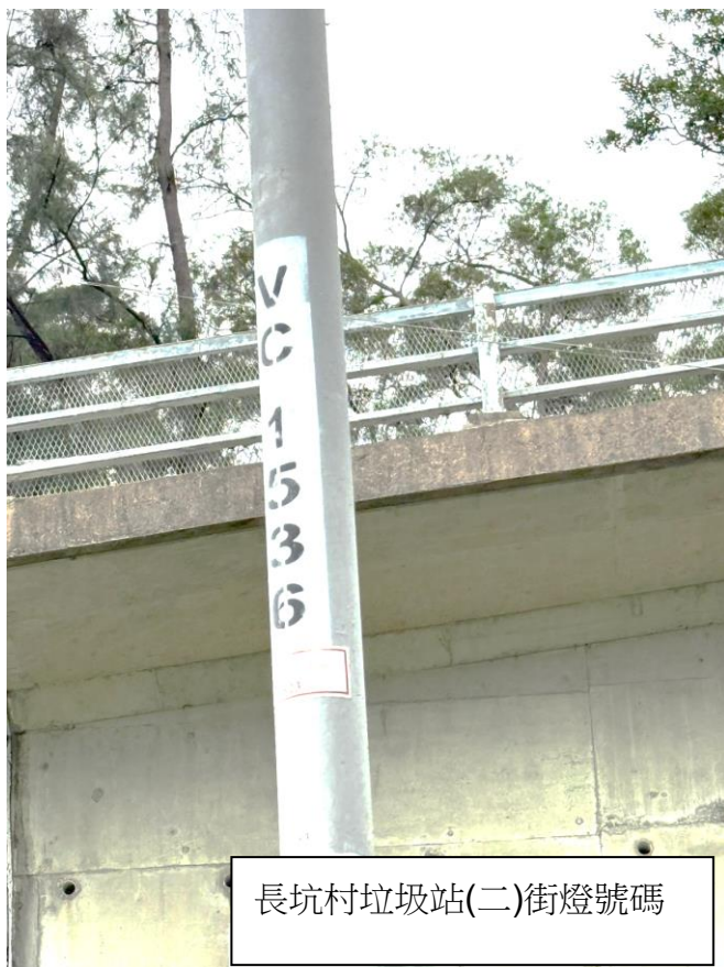
長坑村垃圾站(二)街燈號碼