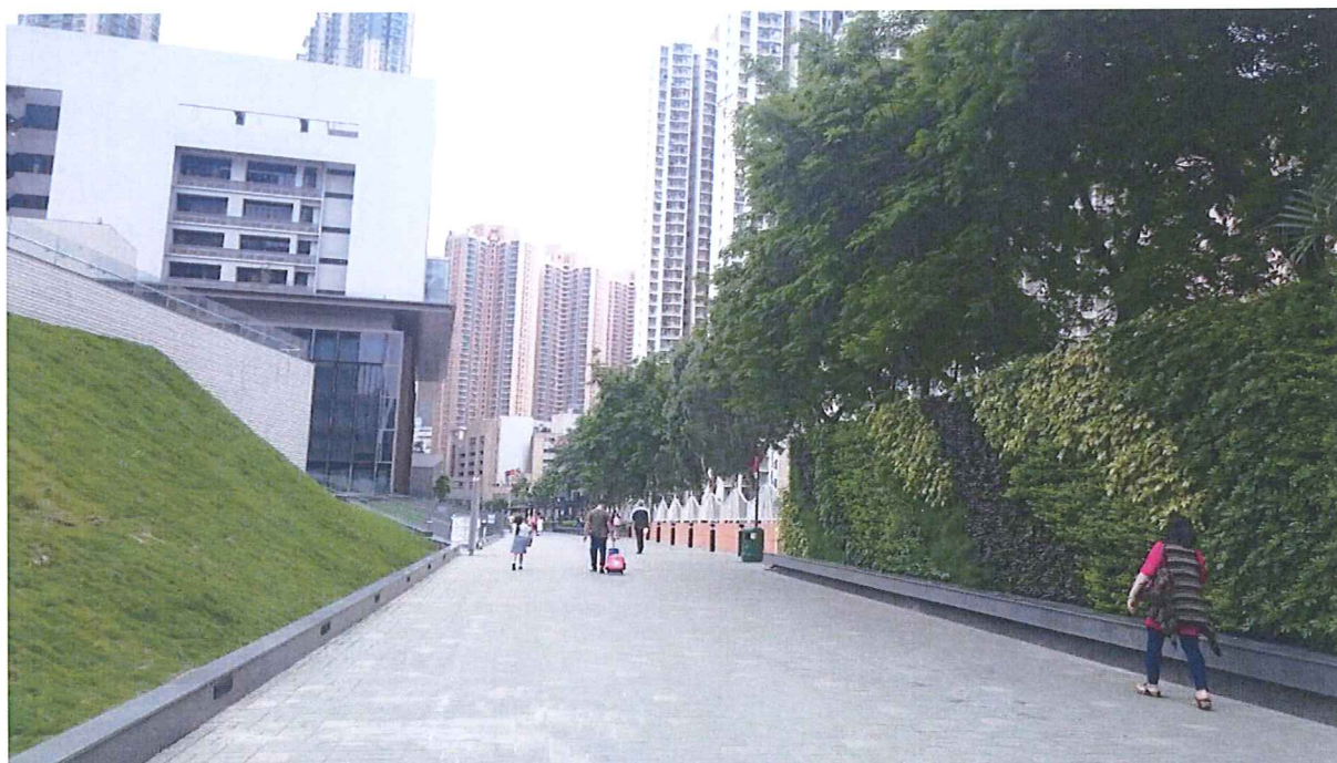
圖書館自修室門外路段