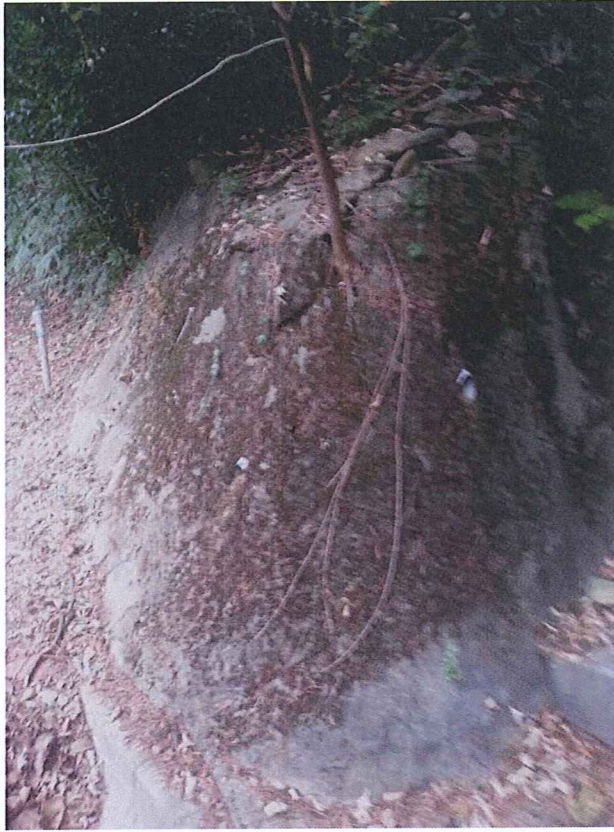
附圖一：斜坡的護土牆已裂開