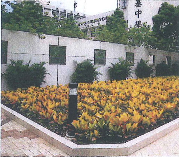
擬加設的照明設施式樣