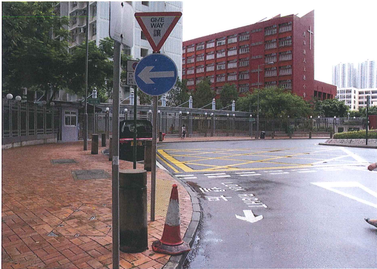
建議在該路段增設長廊避雨蔭棚(約三十米)