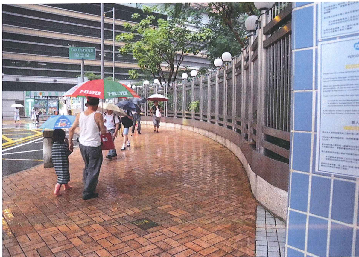
將軍澳中心及唐明苑居民使用該路段