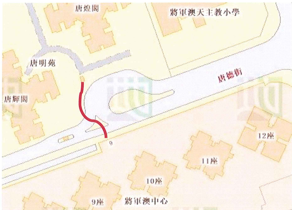
建議由唐德街唐明苑正門前增設長廊避雨蔭棚至將軍澳中心 (見 ——— 所示約三十米) 資料：地政總署