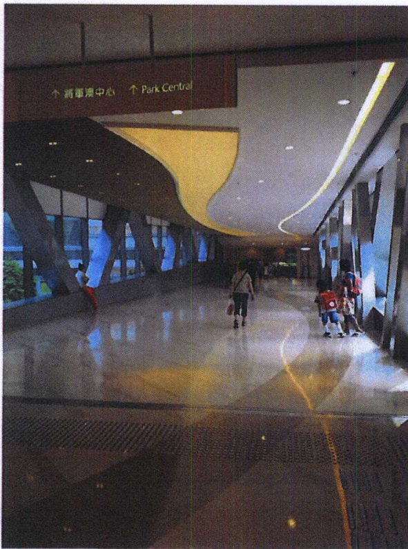
連接將軍澳 56 區物業天晉「PopCorn」商場至將軍澳中心的行人天橋二之內部照片