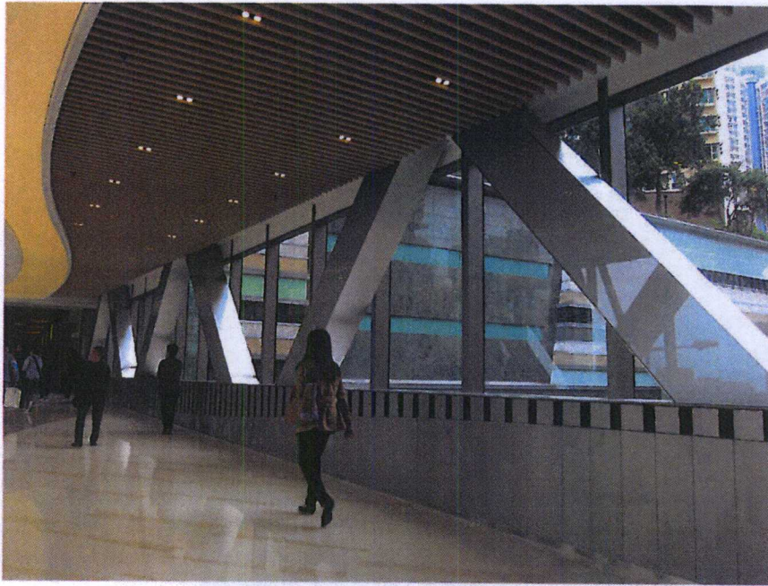
連接將軍澳 56 區物業天晉「PopCorn」商場至將軍澳中心的行人天橋一之內部照片