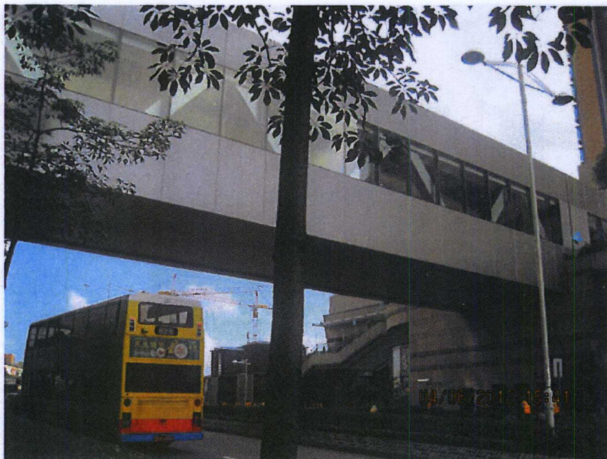
連接將軍澳 56 區物業天晉「PopCorn」商場至君傲灣「君薈坊」商場的行人天橋二 外部照片