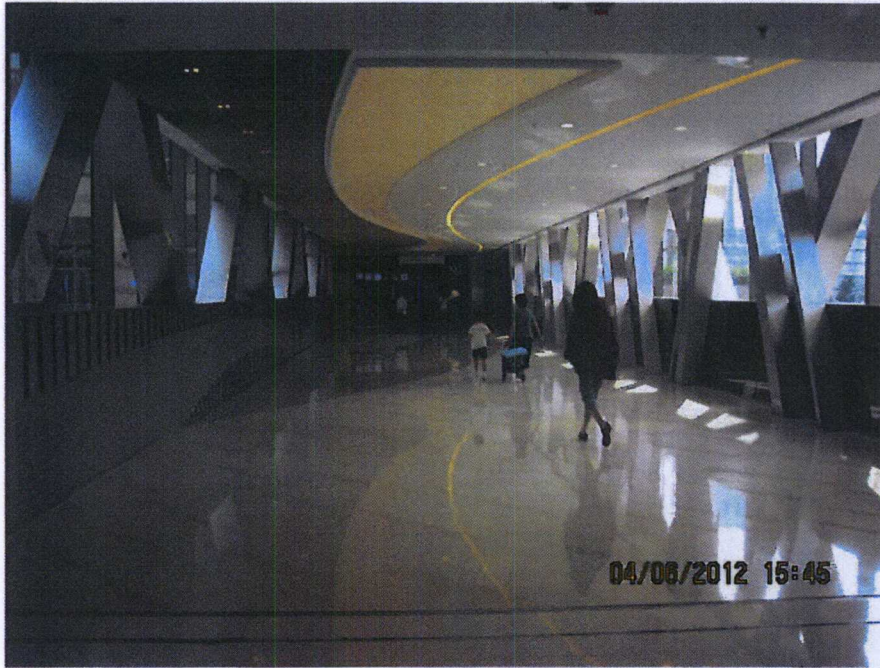
連接將軍澳 56 區物業天晉「PopCorn」商場至君傲灣「君薈坊」商場的行人天橋一 內部照片