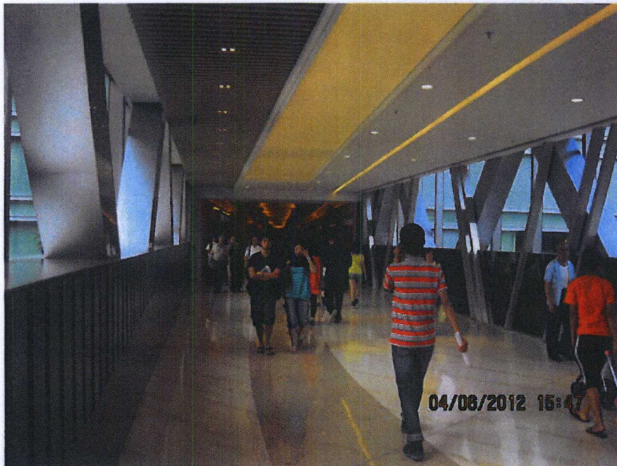
連接將軍澳 56 區物業天晉「PopCorn」商場至君傲灣「君薈坊」商場的行人天橋二 內部照片