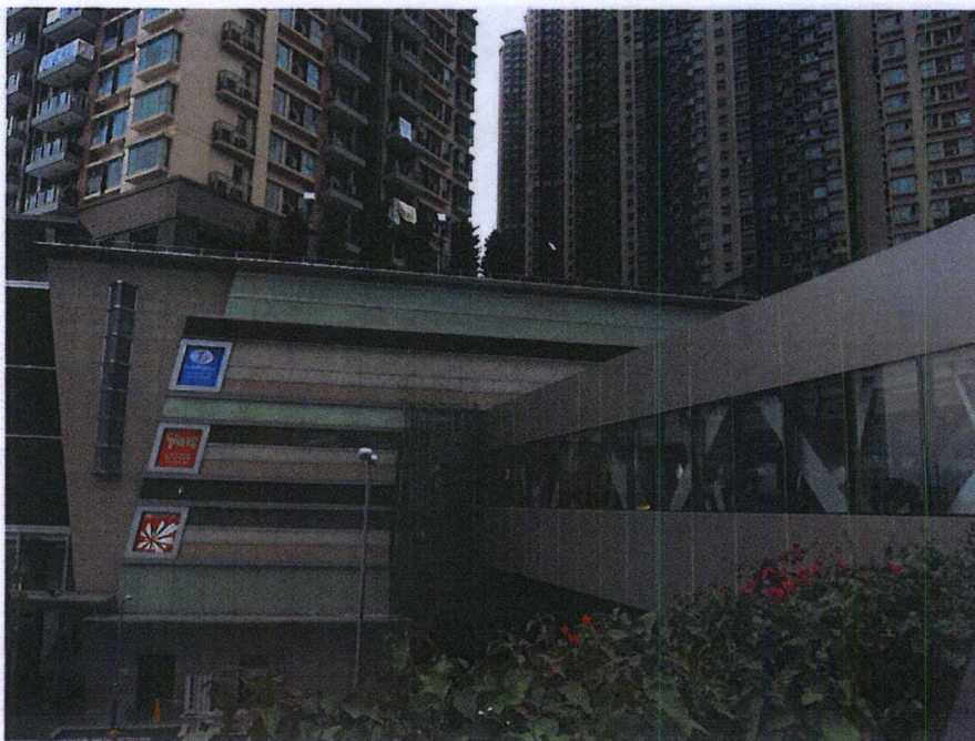
連接將軍澳 56 區物業天晉「PopCorn」商場至將軍澳中心的行人天橋一之外部照片