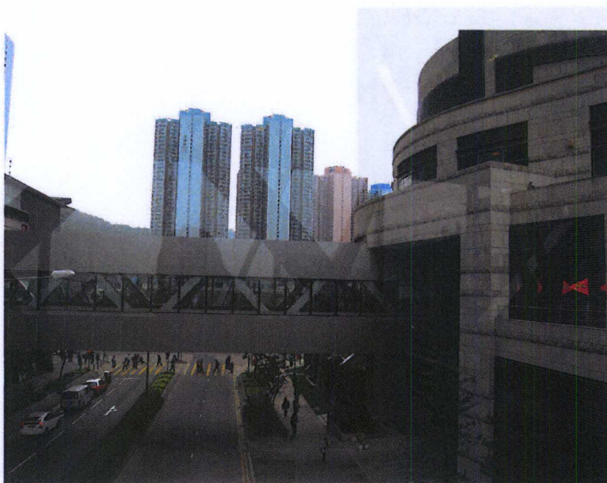
連接將軍澳 56 區物業天晉「PopCorn」商場至將軍澳中心的行人天橋二之外部照片