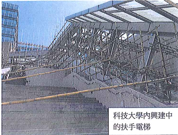
科技大學內興建中的 的扶手電梯