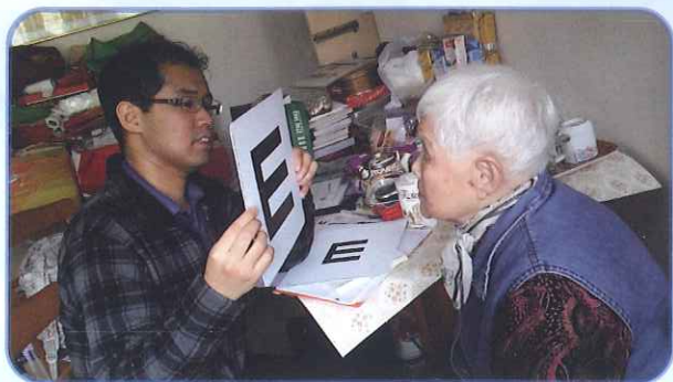
• 視光師為長者作低視能檢查

本會之普通眼科及低視能中心現派遣視光師及職業治療師到戶，為有低視能程度的視障長者進行視覺、家居環境及生活安全多方面之評估。