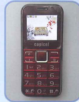
• 大字發聲手提電話