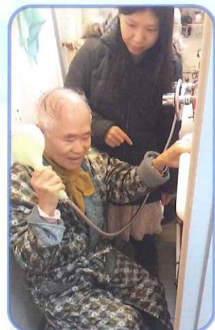
• 職業治療師為長者進行沐浴安全之評估