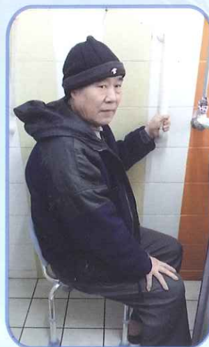
• 改用沐浴椅，代替矮椅子，減少因起立時不穩而跌倒。